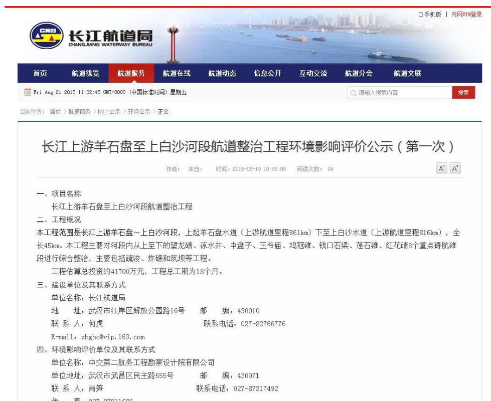
图 2-1 首次环境影响评价信息公示网站截图