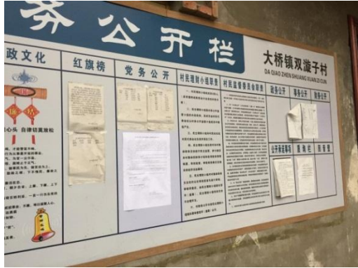
大桥镇双漩子村张贴公示