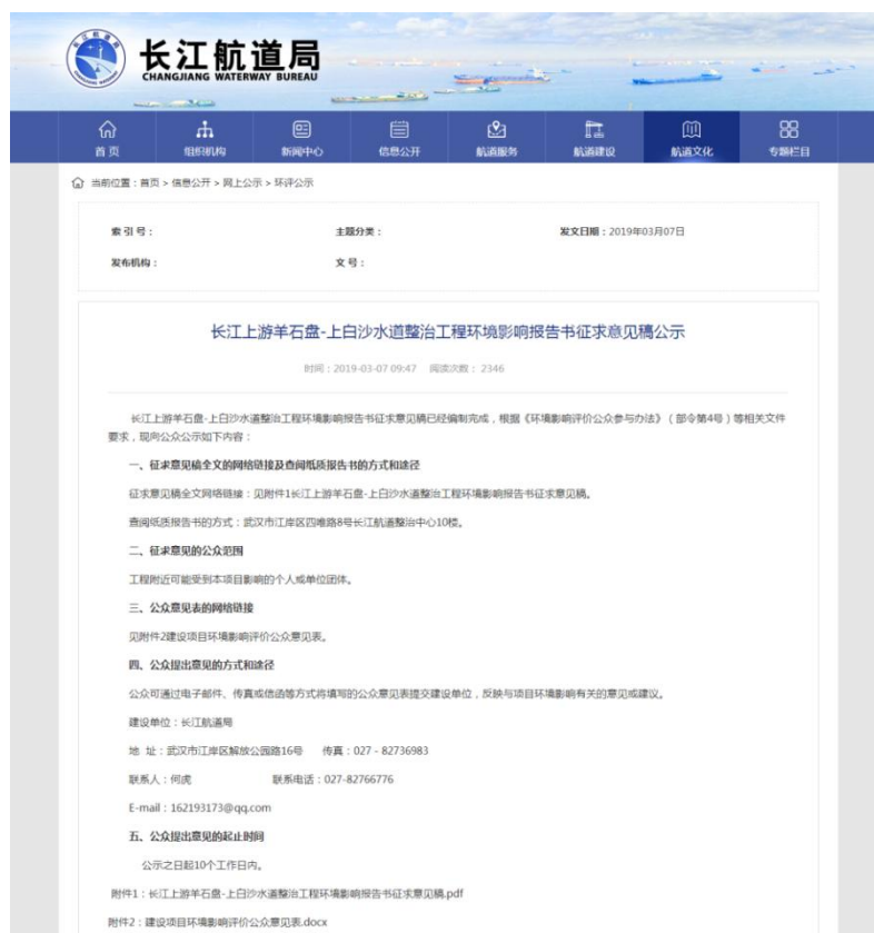
图 3-1 征求意见稿公示（长江航道局）网站截图