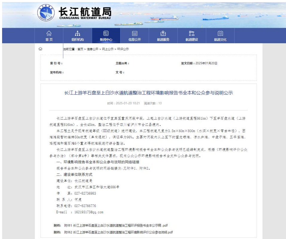
图 6-1 报告书全本及公众参与说明公示（长江航道局）网站截图