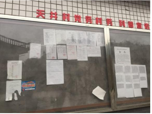
符阳街道文桥村（原天井村）张贴公示