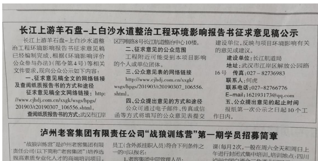
图 3-4 泸州日报公示（3 月 21 日）照片