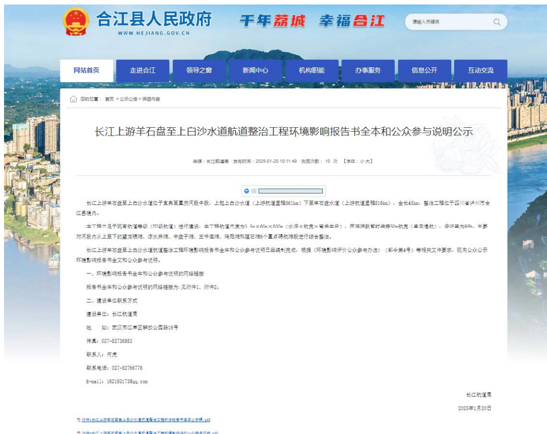
图 6-2 报告书全本及公众参与说明公示（合江县人民政府）网站截图