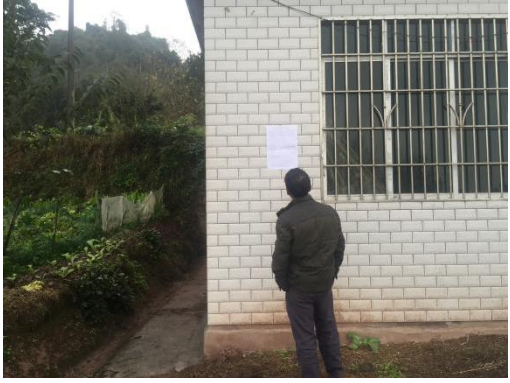
白沙镇原岐山村张贴公示