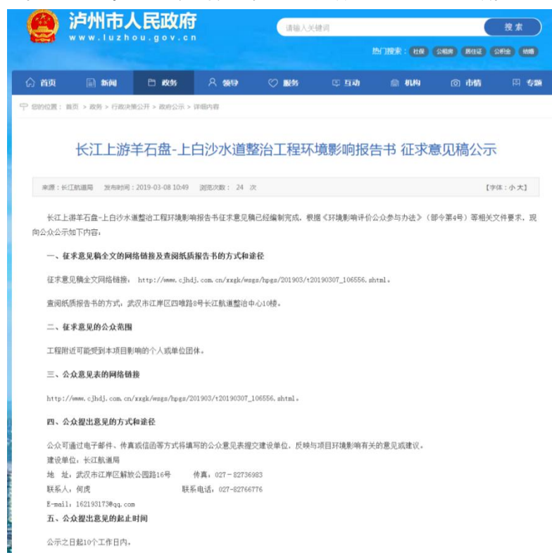
图 3-2 征求意见稿公示（泸州市人民政府）网站截图