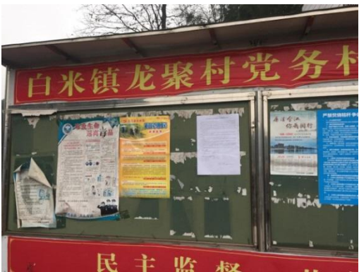
白米镇原龙聚村张贴公示