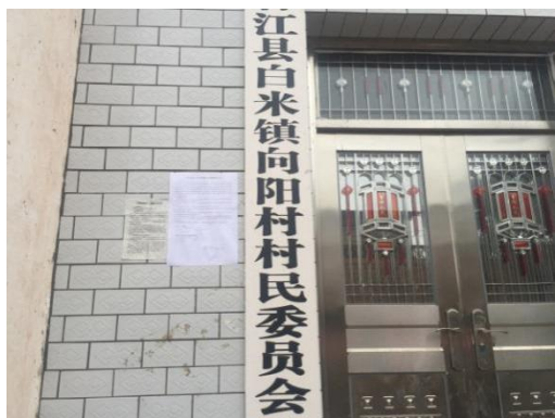
白米镇向阳村张贴公示