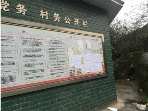
大桥镇高鼓山村（原望龙山村）张贴公示