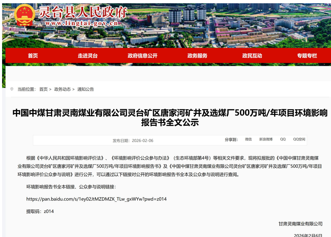
图 5 网络公示情况