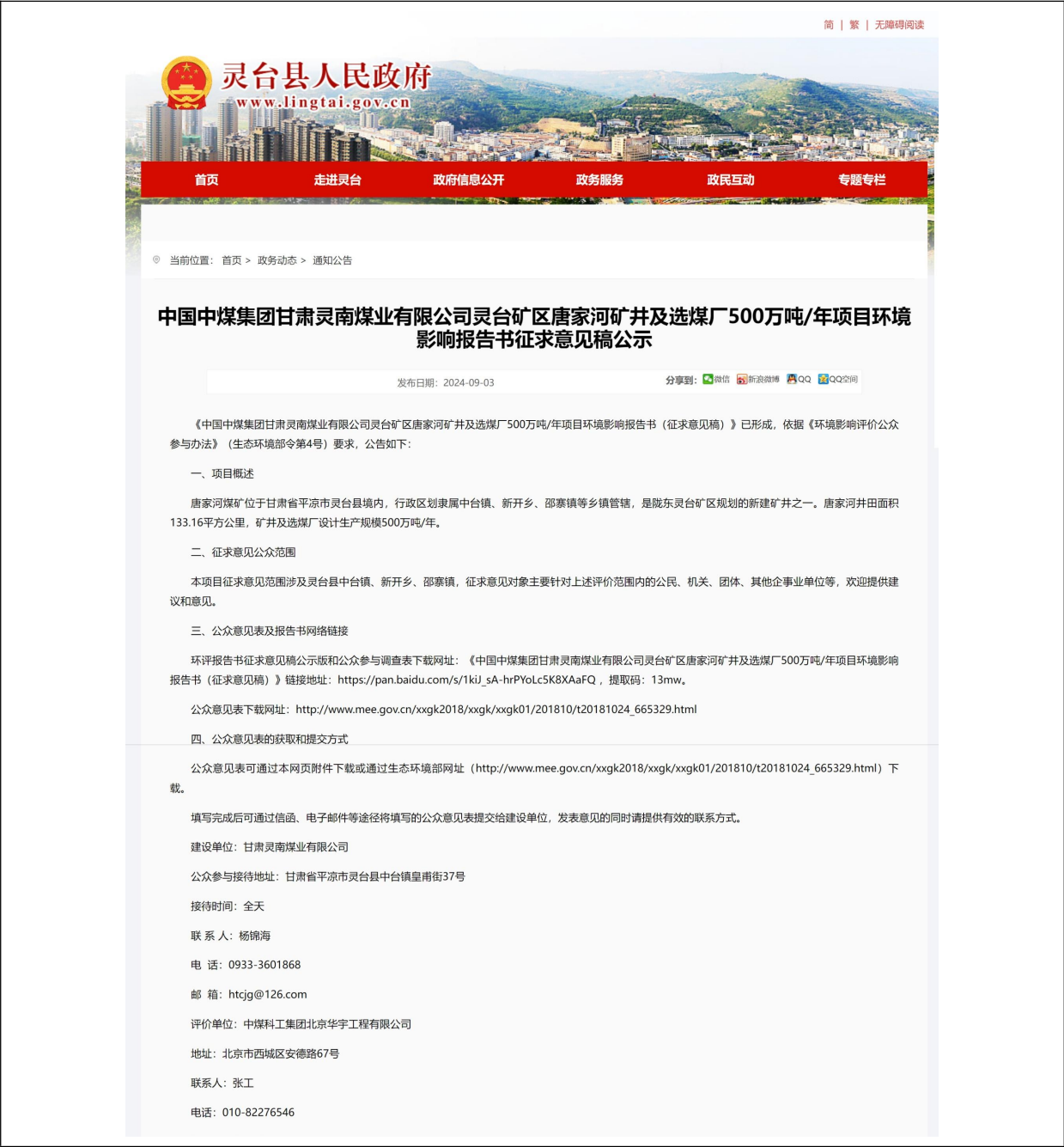
图 2 项目网站公告情况