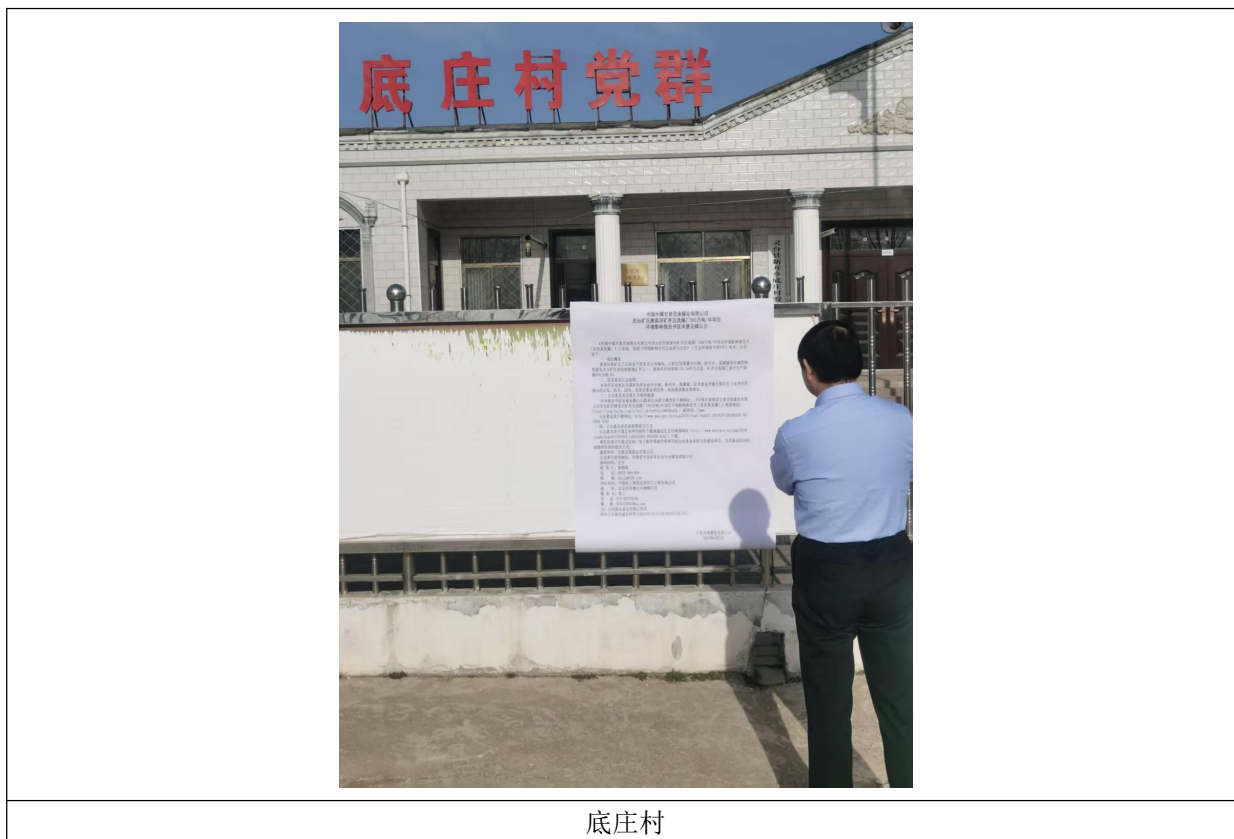
图 4 张贴公告情况