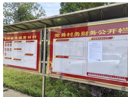
青林村委会（双堰湾\丰台组\青林组\冲天组\建楼组\李子组\阴阳湾）