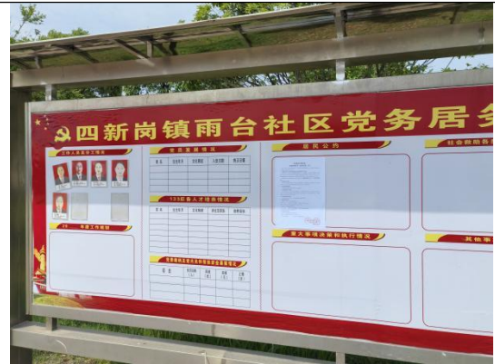
雨台社区居委会（浦家咀\杨家庙\彩芳湾\尾家湾）