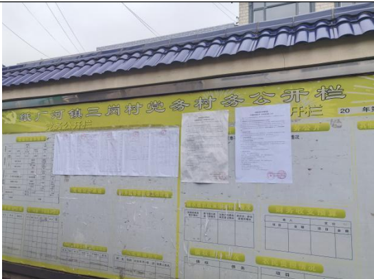
三岗村委会（三岗村五组）