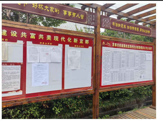
龙塘村民委员会（回龙塘村四组\十一组）