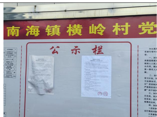
岭村委会（横岭村五组五组\六组）