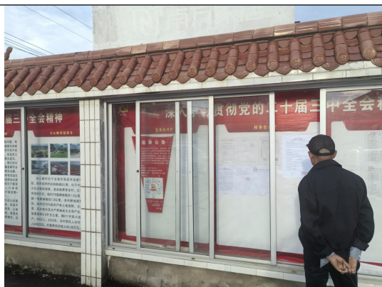
全心畈村民委员会（全心畈村四组\五组村）