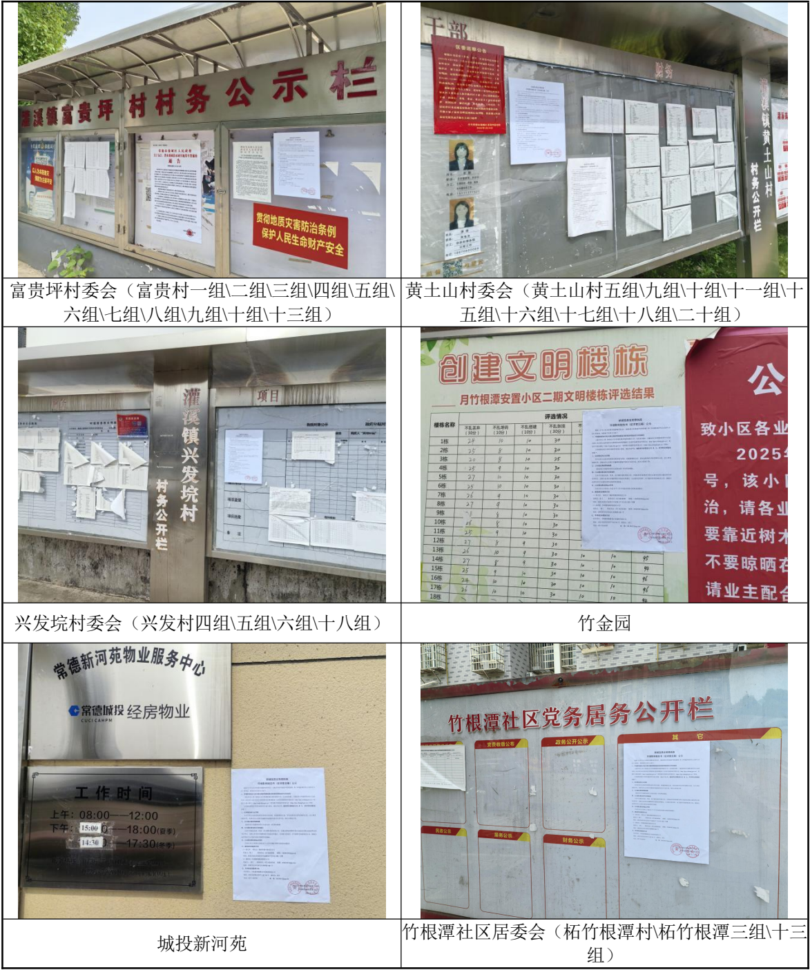
图 3-9 现场张贴公告照片

建设单位在单位设置了查阅场所,并放置了纸质的环境影响报告书(征求意见稿),供公众查阅。公示期间没有人到现场查阅。