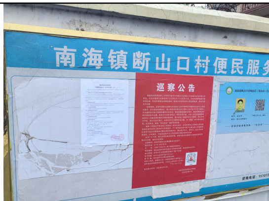
断山口村委会（断山口村一组\二组\三组）