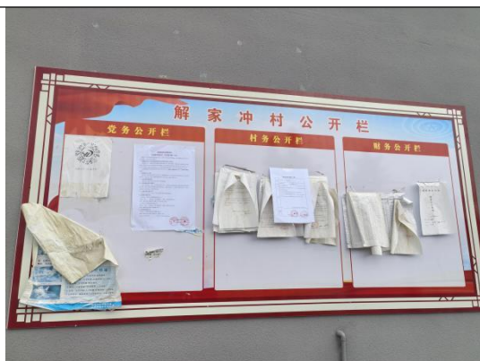
解家冲村民委员会（解家冲村四组、五组）