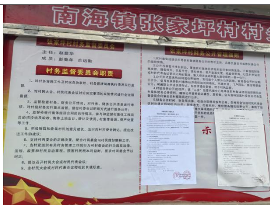
张家坪村委会（张家坪村三组\四组\七组\八组\十二组）