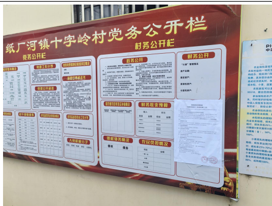
十字岭村委会（十字岭村五组\六组\七组\九组\十组）