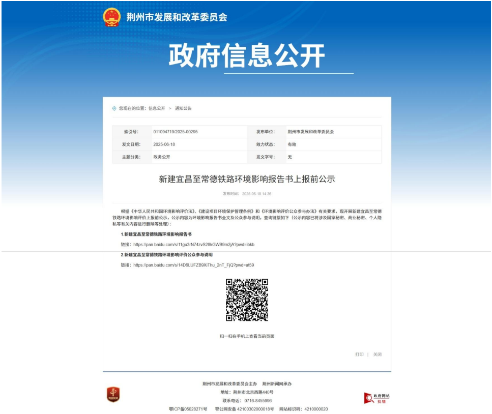
图 5-2 上报前公示网站截图——荆州市发展和改革委员会