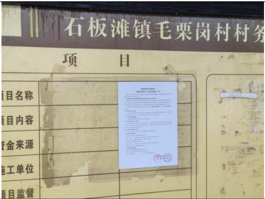
毛栗岗村委会（毛栗岗村三组\五组）