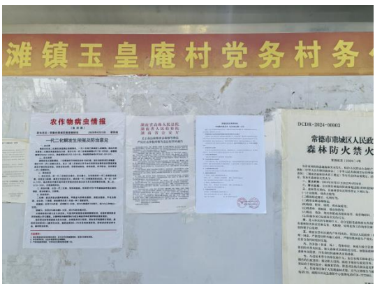
玉皇庵村委会（玉皇庵村九组）