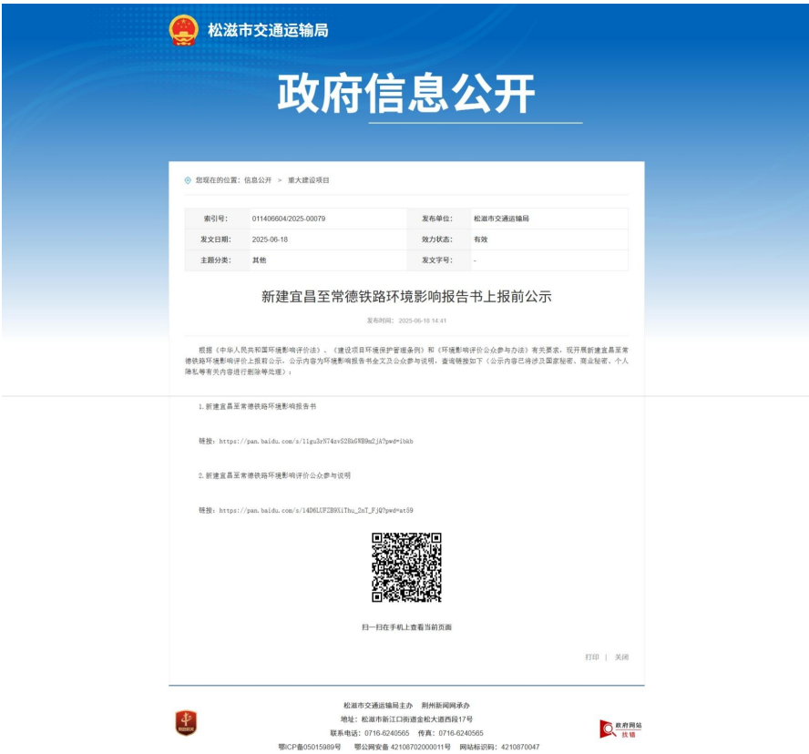
图 5-3 上报前公示网站截图——松滋市交通运输局