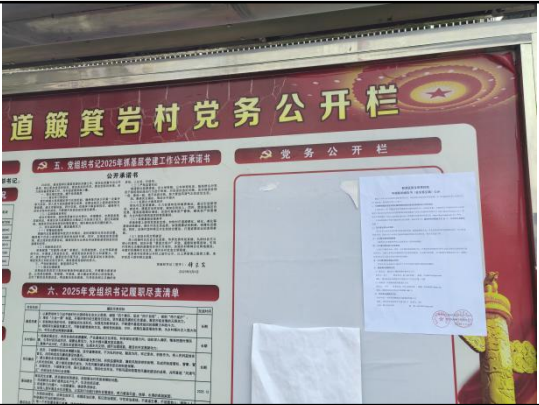
簾箕岩村民委员会（中水桥村一组\二组\三组\四组）