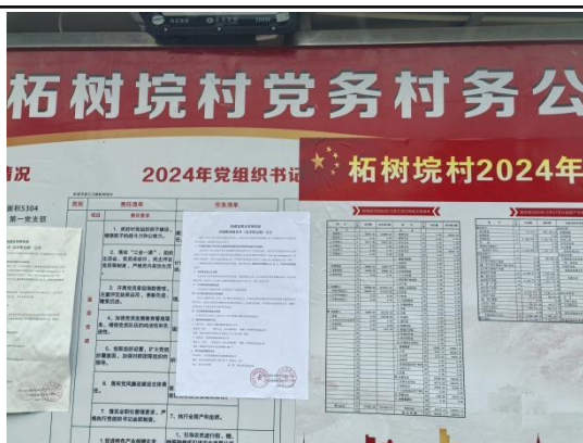
柘树垅村委会（柘树垅村五组\十一组）