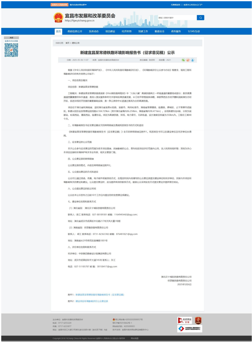
图 3-2 第二次公示网站截图——宜昌市发展和改革委员会

建设单位分别在宜昌市发展和改革委员会、荆州市发展和改革委员会（fgw.zwggk.jingzhou.gov.cn）、松滋市交通运输局、常德市发展和改革委员会网站进行了环评第二次（征求意见稿）公示，网站链接了公示内容、环境影响评价公众意见表、环境影响报告书的征求意见稿，且公示期间均对外开放，网站截图如下：