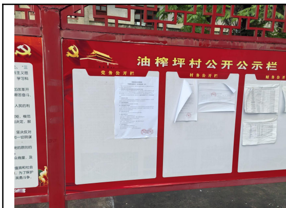
油榨坪村民委员会（油榨坪村二组\三组）