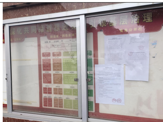
余家桥村民委员会（余家桥村一组\三组\四组\六组\七组）