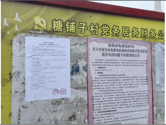
糖铺子村委会（糖铺子村三组\四组）