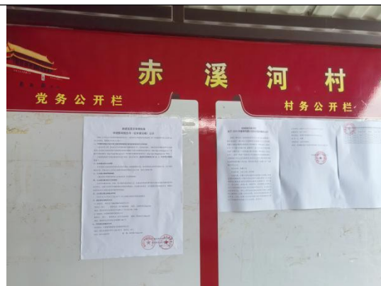
赤溪河村民委员会（赤溪河村五组）