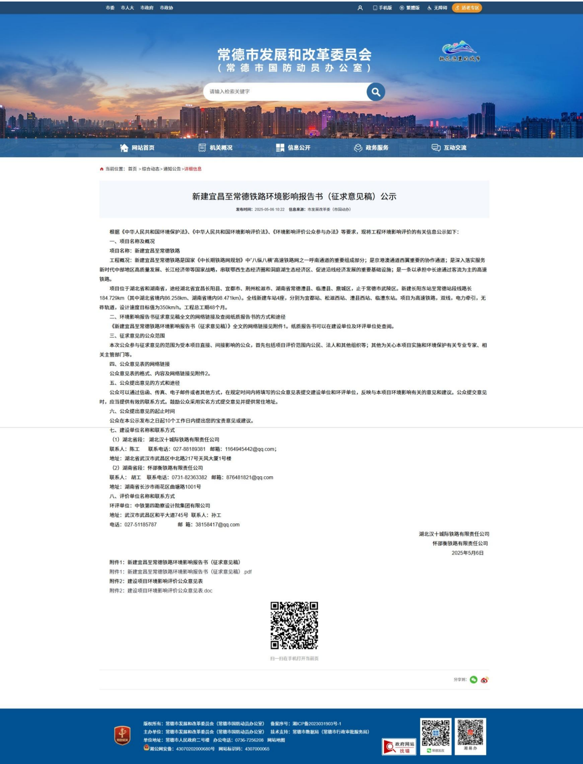
图 3-5 第二次公示网站截图——常德市发展和改革委员会

公示网站为宜昌市发展和改革委员会、荆州市发展和改革委员会、松滋市交通运输局和常德市发展和改革委员会网站，网站均面向社会公开，公示时间满足 10 个工作日的要求，符合《环境影响评价公众参与办法》要求。