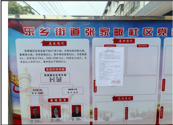
张家畈村民委员会（张家畈村一组）