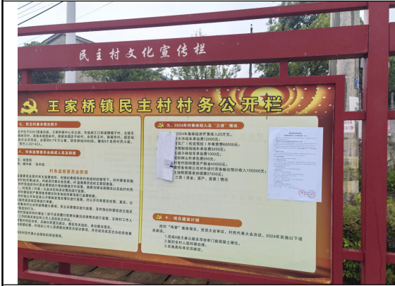
民主村民委员会（民主村三组\四组）