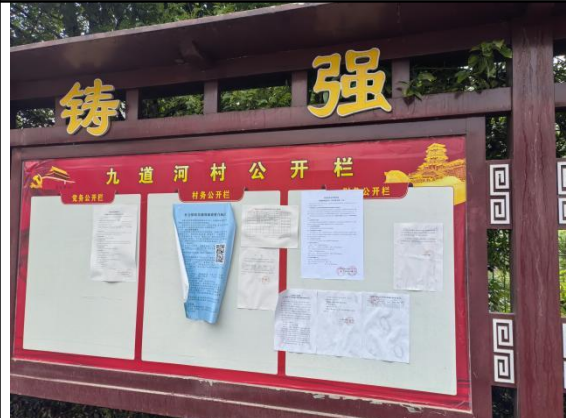
解家冲村民委员会（九道河村四组\五组\七组）、九道河村陡岩子搬迁安置小区