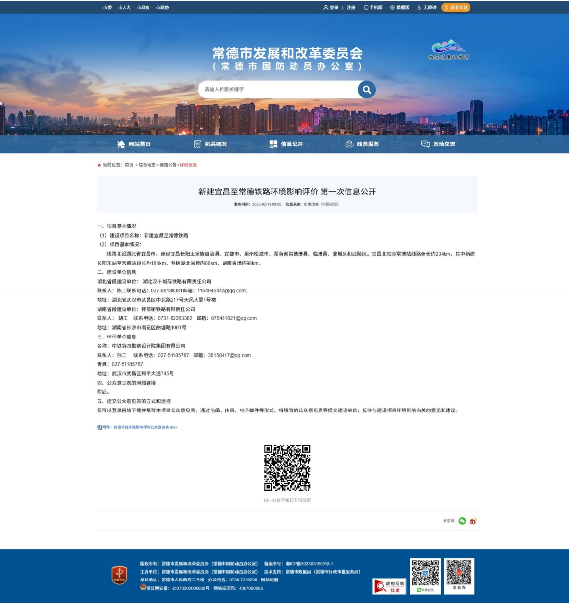
图 2-4 第一次公示网站截图——常德市发展和改革委员会