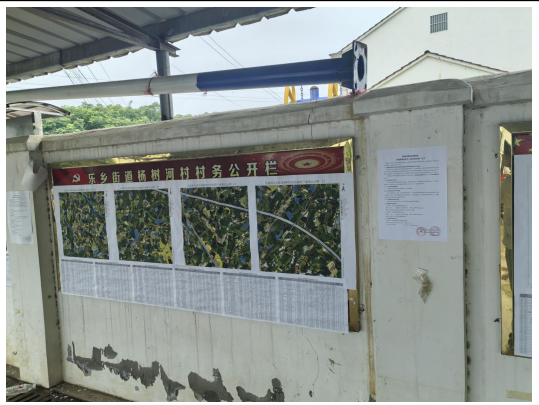
杨树河村民委员会（杨树河村一组、二组、三组、四组）