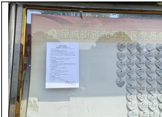
和平社区居委会（和平社区老屋\长兴组\土桥组\板桥组\六一组\宝垱组）