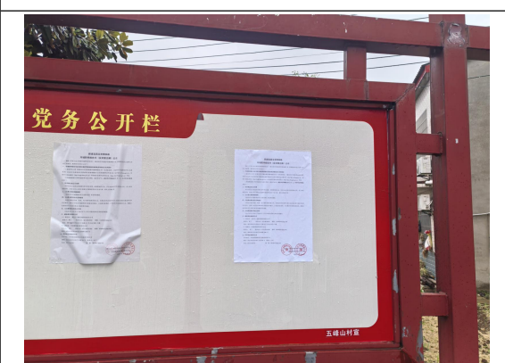
五峰山村民委员会（五峰山村一组\二组\二组1\四组）