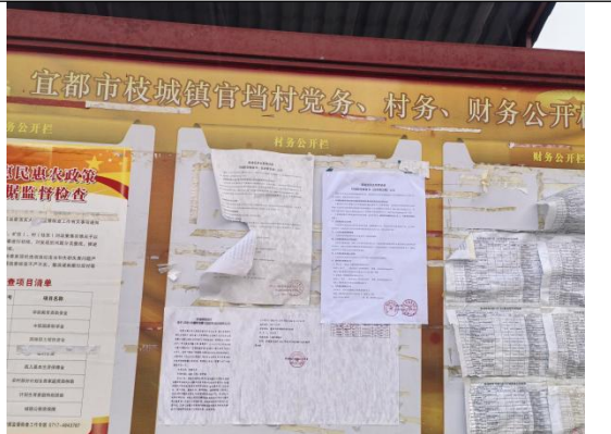
官垱村民委员会（官垱村八组、八组2）