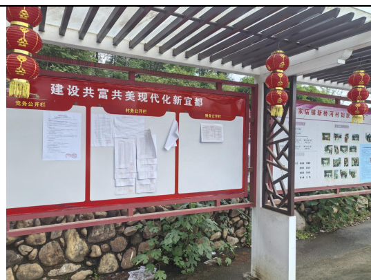
新桥河村民委员会（新桥河村一组\二组\四组\六组）