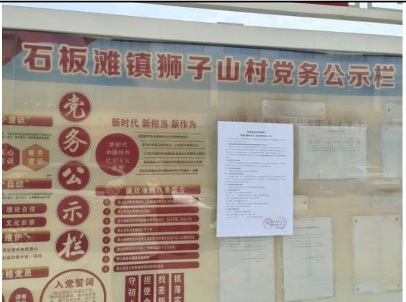
狮子山村委会（狮子山村五组\六组）