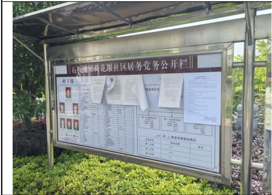
荷花堰村委会（荷花堰村一组\二组\三组）