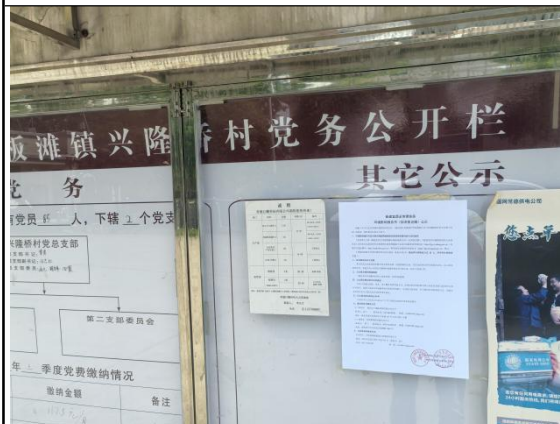
兴隆桥村委会（兴隆桥一组\二组\三组\四组\六组\七组）