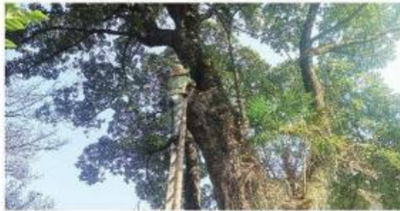
宜昌市夷陵区峡口乡多宝寨村古树

宜昌市夷陵区位于三峡工程核心库区，是三峡库区生态屏障的重要组成部分。随着三峡库区生态屏障的构建，宜昌市夷陵区古树名木保护工作也面临着新的挑战。据夷陵区林业和园林局相关负责人介绍，夷陵区共有古树名木1000余株，其中百年以上古树名木300余株。这些古树名木不仅是宜昌市夷陵区历史文化名城的重要载体，也是宜昌市夷陵区生态屏障的重要组成部分。