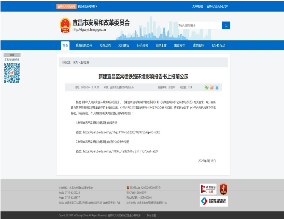
图 5-1 上报前公示网站截图——宜昌市发展和改革委员会

环评文件上报前，2025 年 6 月 18 日，建设单位分别在宜昌市发展和改革委员会、荆州市发展和改革委员会、松滋市交通运输局、常德市发展和改革委员会网站进行了上报前公示，公示了本项目环境影响报告书全文和公众参与说明材料。网站截图如下。