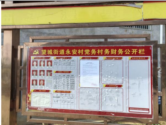
永安村委会（永安村荷花组\胡咀组\石桥组）