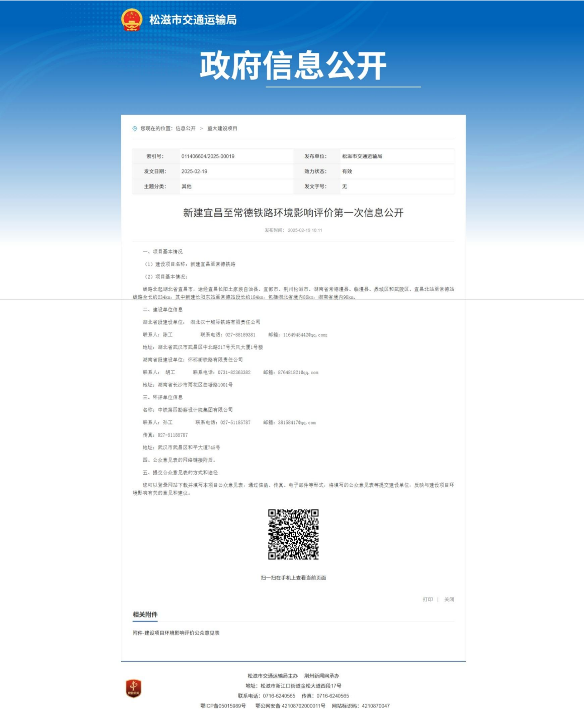
图 2-3 第一次公示网站截图——松滋市交通运输局