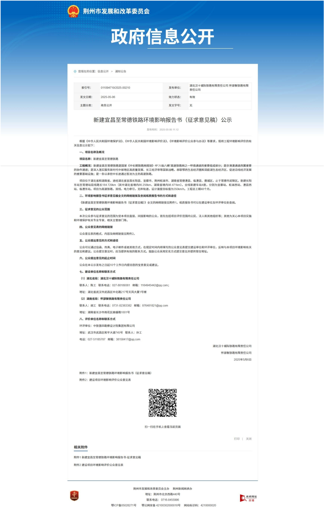
图 3-3 第二次公示网站截图——松滋市交通运输局