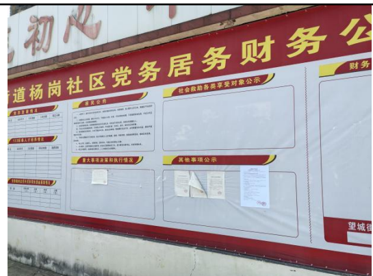
杨岗社区居委会（杨岗社区白体组\水泵组\幺堰组\金岗组\脚门口）