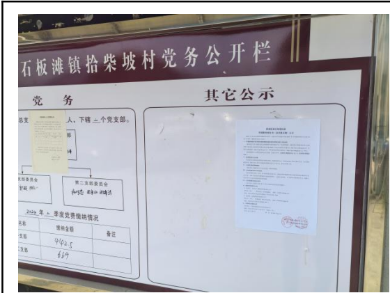
拾柴坡村委会（拾柴坡村三组\六组