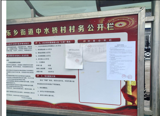
中水桥村民委员会（中水桥村一组\三组）