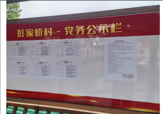
彭家桥村民委员会（彭家桥村三组\四组）