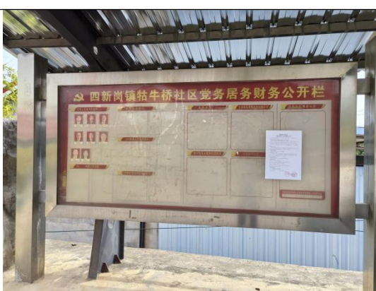
牯牛桥社区居委会（红咀湾\李家湾\王家湾\下周组\国治组\雪湾）