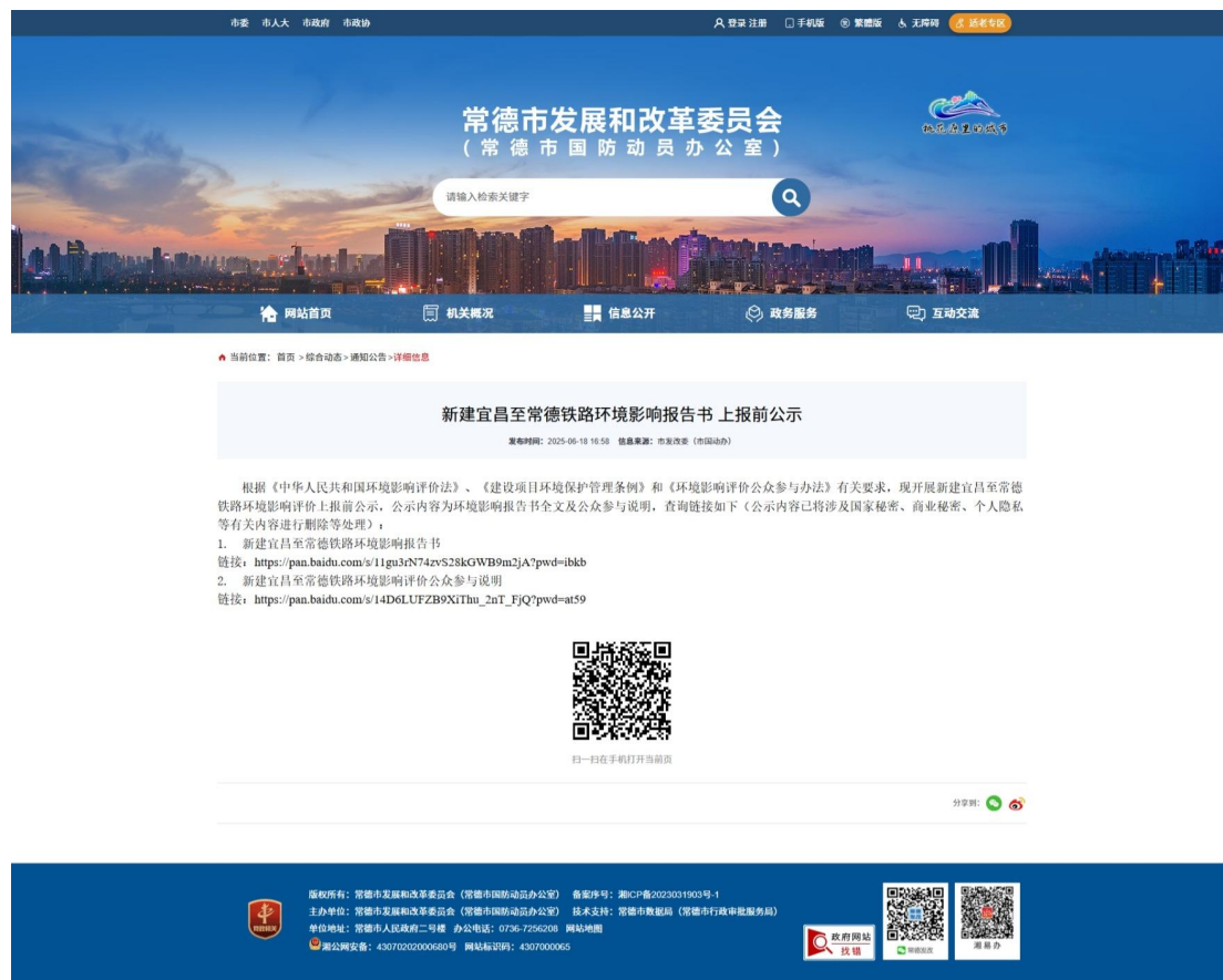
图 5-4 上报前公示网站截图——常德市发展和改革委员会