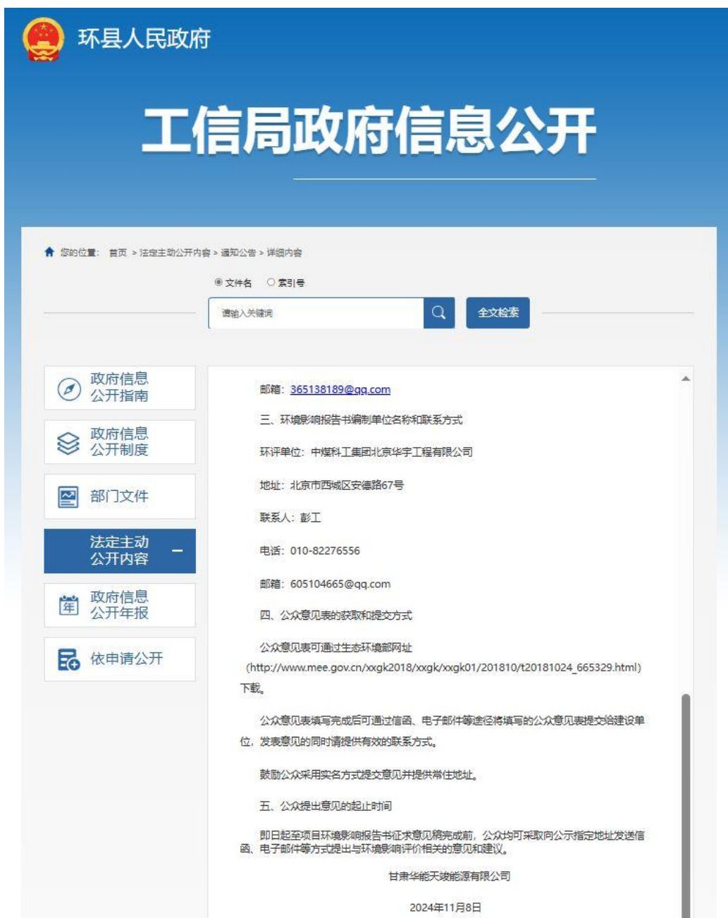
图 1 项目网站公告情况