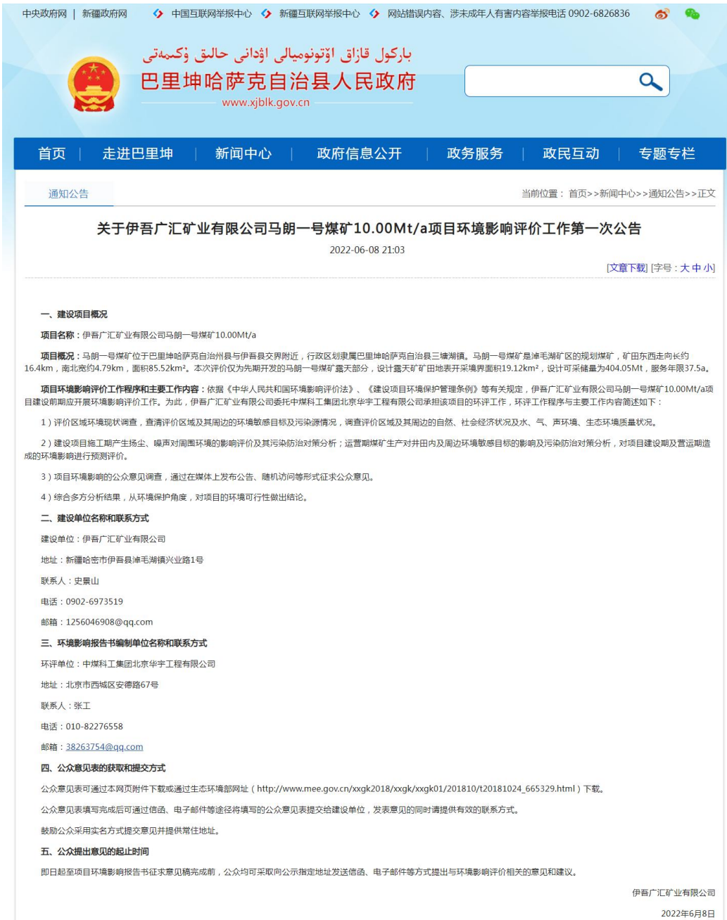
图 1 第一次网络公示环评信息情况