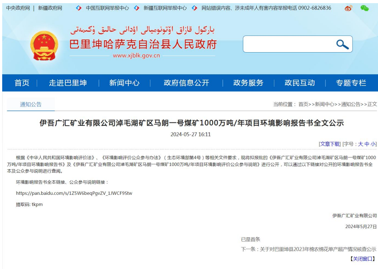
图 6 项目报批前网络公示情况

http://www.xjblk.gov.cn/xjblk/c119963/202405/1735c7aa37674799b9163d72a0037df1.shtml