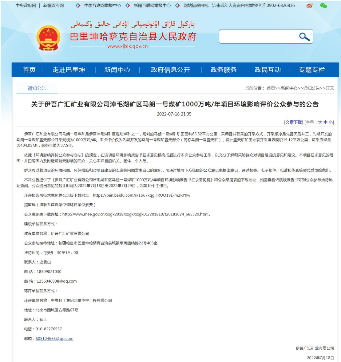
图 2 项目网站公告情况

我单位在当地主流报纸《哈密日报》刊登了《关于伊吾广汇矿业有限公司淖毛湖矿区马朗一号煤矿 1000 万吨/年项目环境影响评价公众参与的公告》，就建设项目概况、环境影响报告书征求意见稿全文的网络链接及查阅纸质报告书的方式和途径、公众意见表的网络链接、公众提出意见的方式和途径、公众提出意见的起止时间等进行了公示，