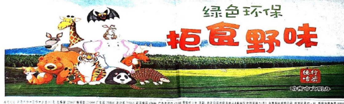
图3 项目报纸公告情况(2022年7月26日报纸公告)