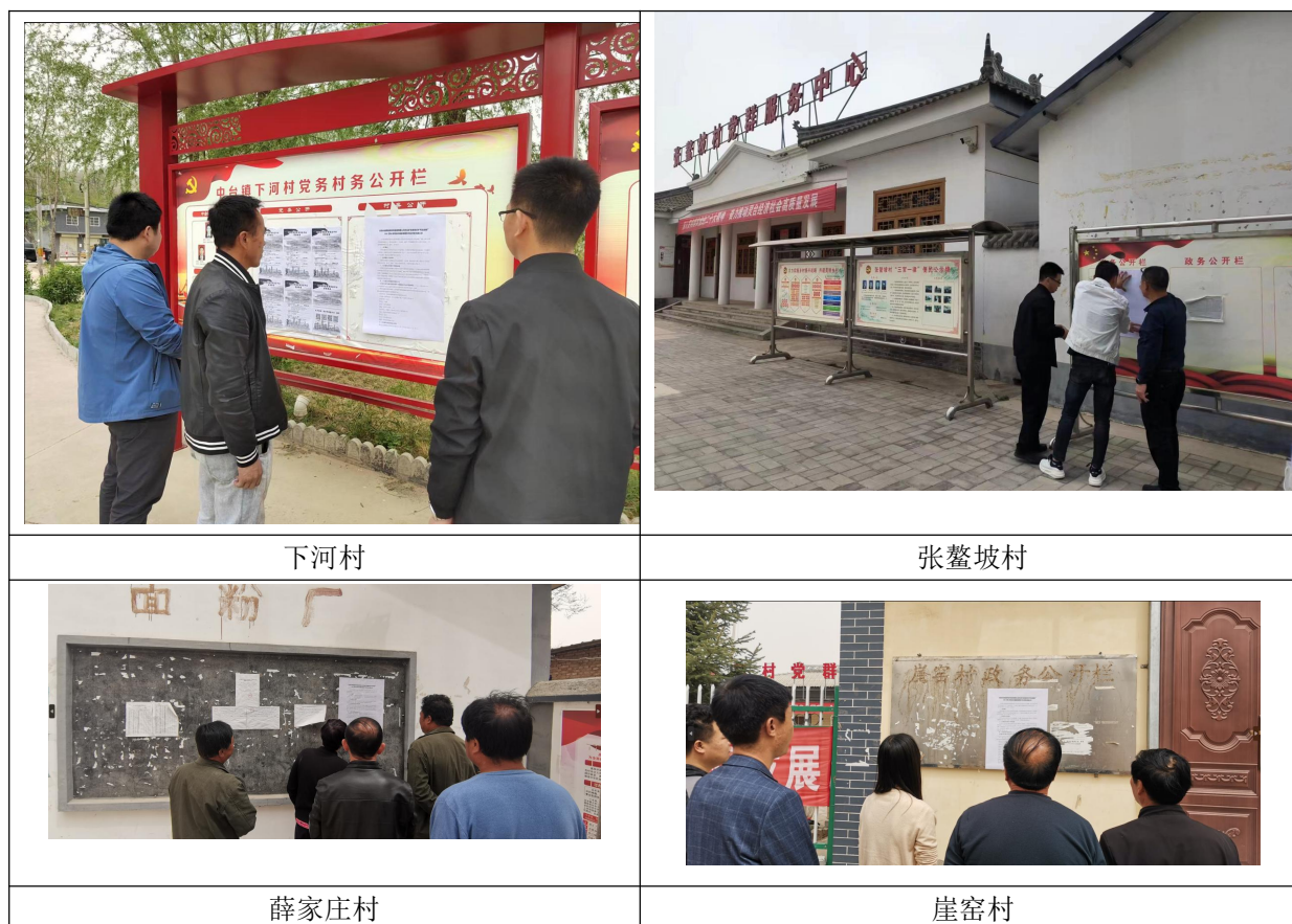
图 4 张贴公告情况