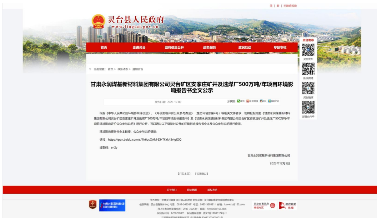
图 5 网络公示情况