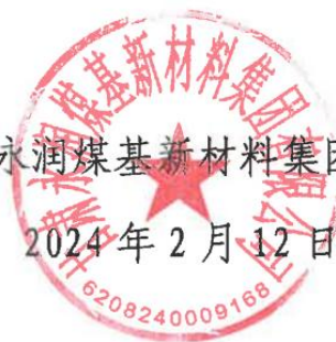
图 6 建设单位诚信承诺函