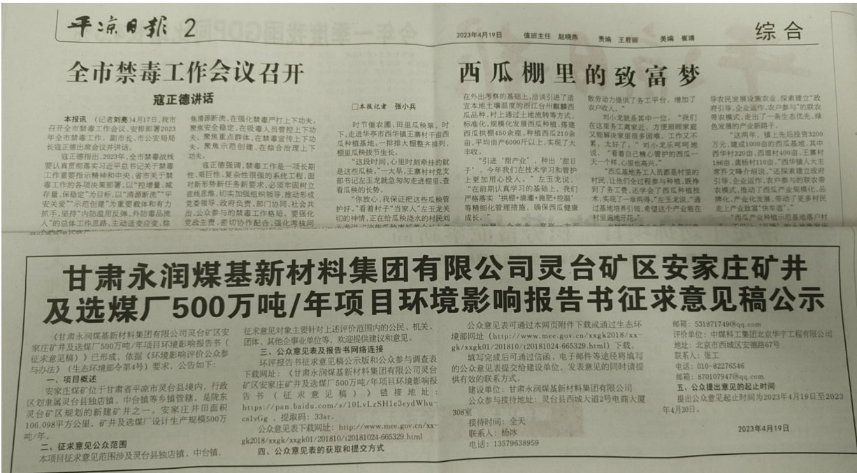
4 月 19 日报纸公告