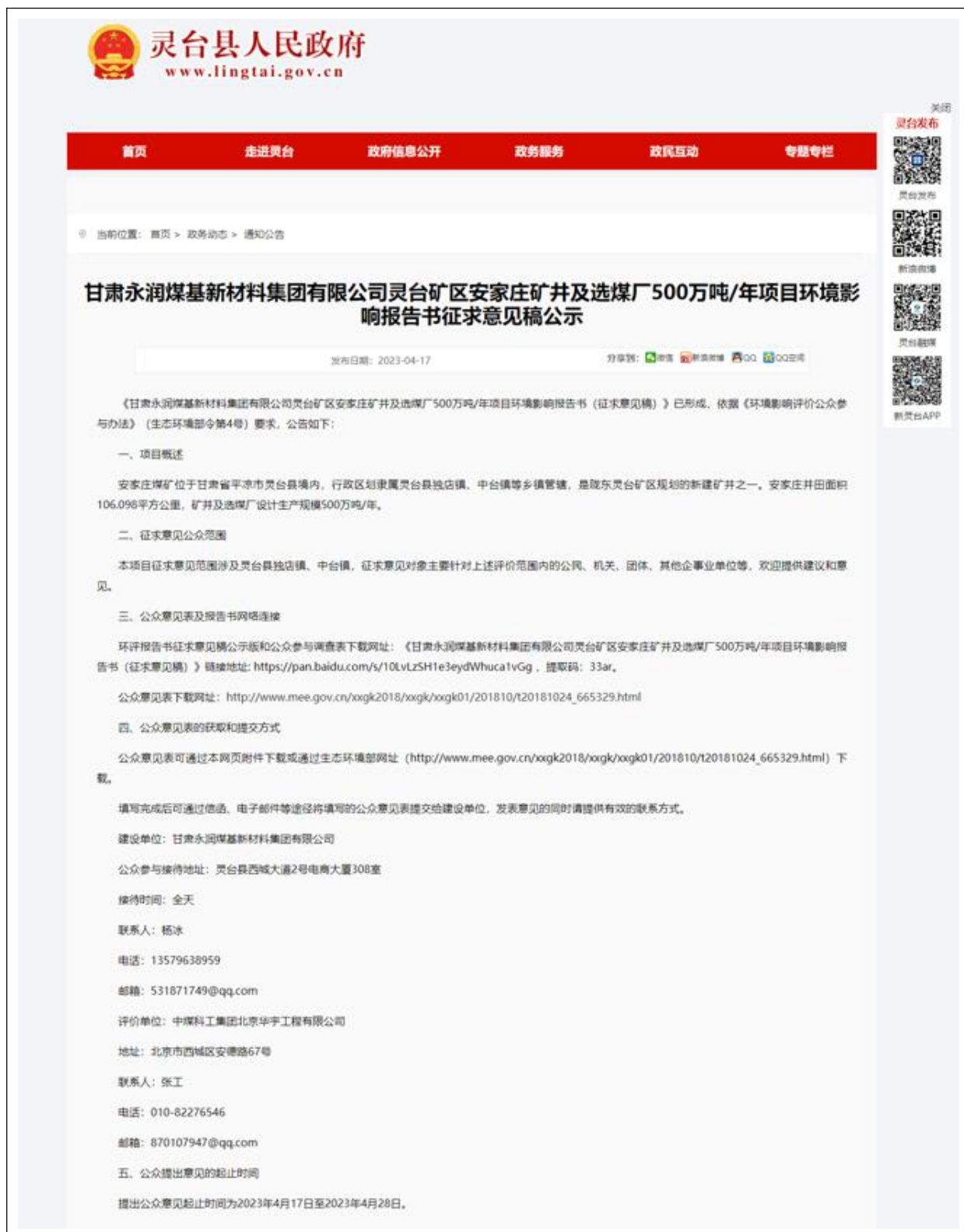
图 2 项目网站公告情况