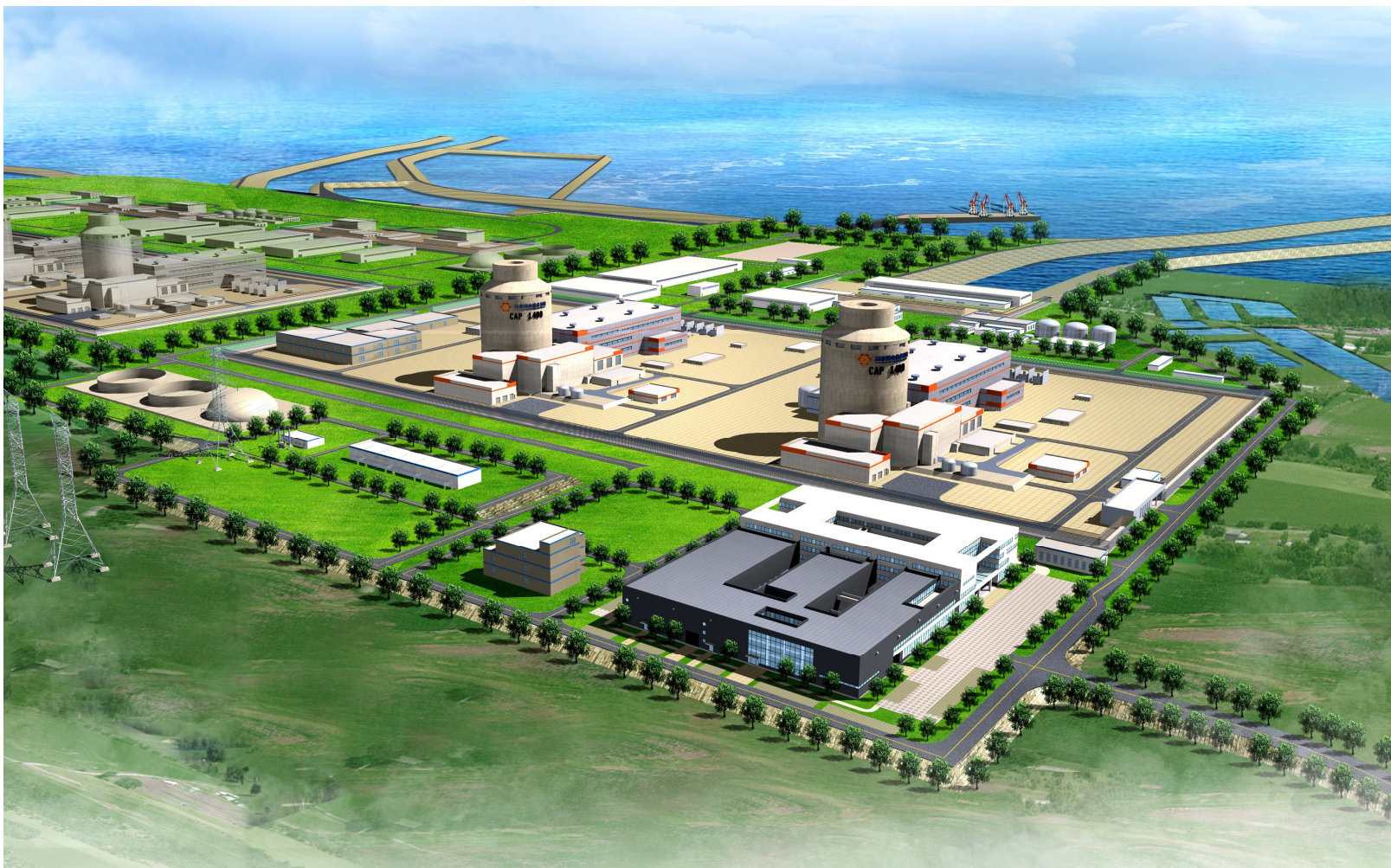
图 2 国核压水堆示范工程效果图