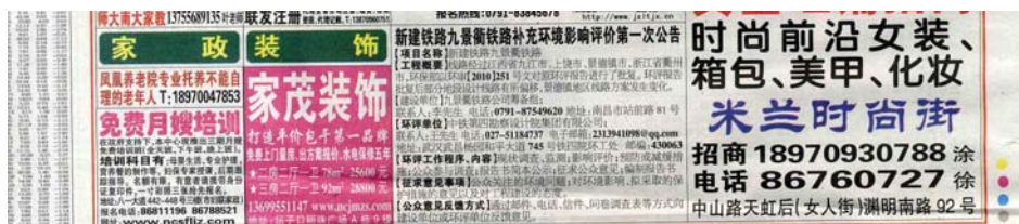
在《南昌晚报》、《今日早报》刊登第一次公告

2013年3月22日在《信息日报》(江西省)及《今日早报》(浙江省)和 中铁第四勘察设计院集团有限公司(www.crfds.com)网站上进行新建铁路九景衢铁路补充环境影响评价第二次公示, 并同时刊登报告书简本, 向公众提供