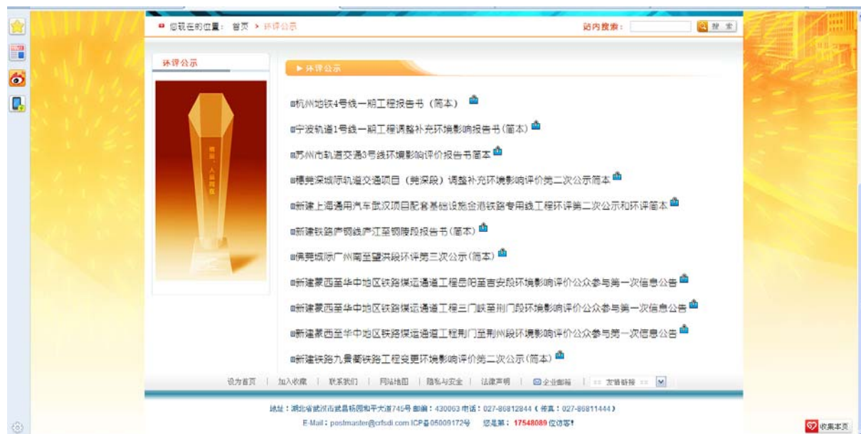
在“铁四院网站”刊登第二次公示和简本公示