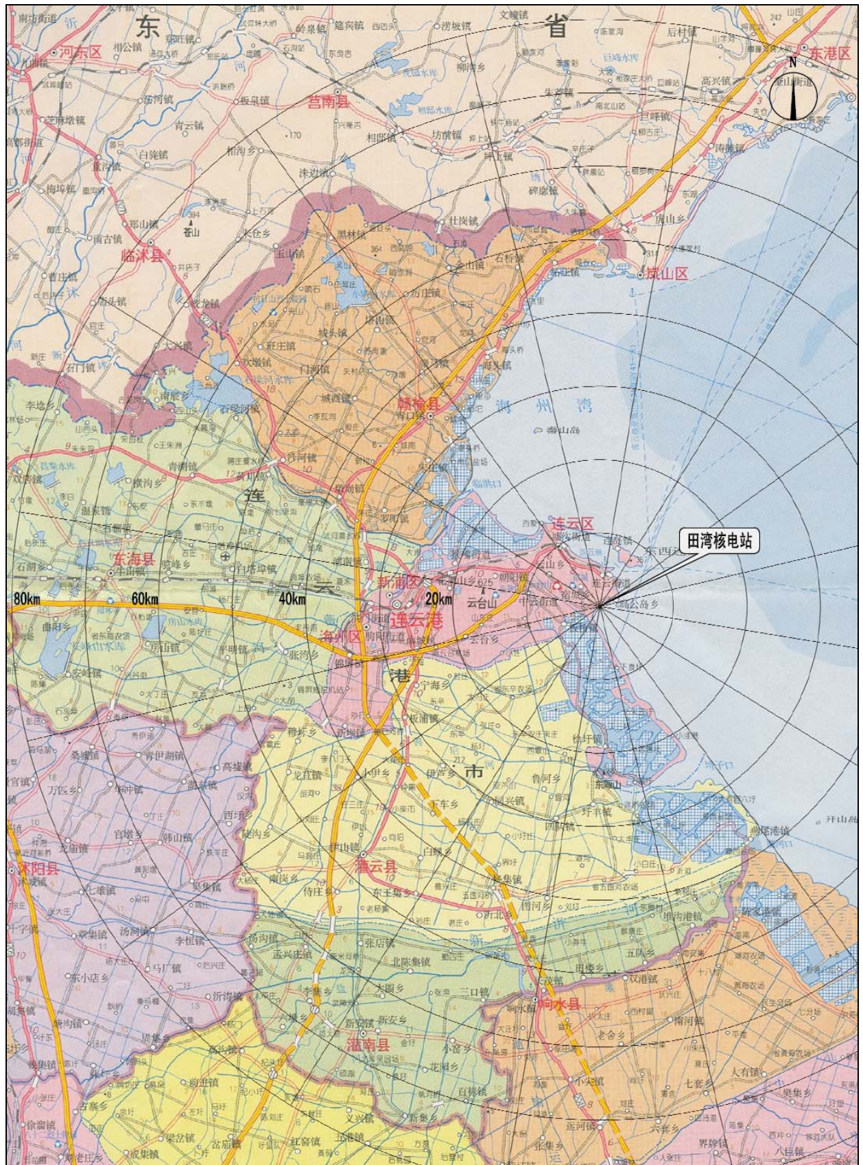
图 1 田湾核电站评价范围图

以田湾核电站 3 号机组的烟囱为中心，半径 80km 的地域范围。辐射影响评价范围和评价子区的划分见图 1。