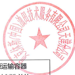
测井源及其运输容器相关信息表