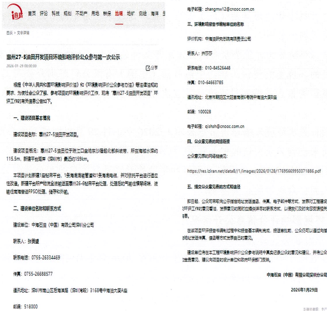
图 1 首次环境影响评价信息公开网络截图