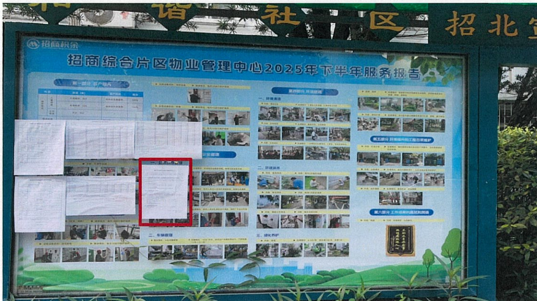
图 6 征求意见稿张贴公告照片 2