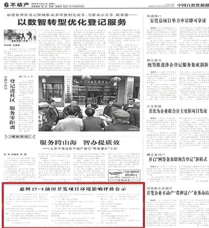
图 4 征求意见稿公示报纸照片 2