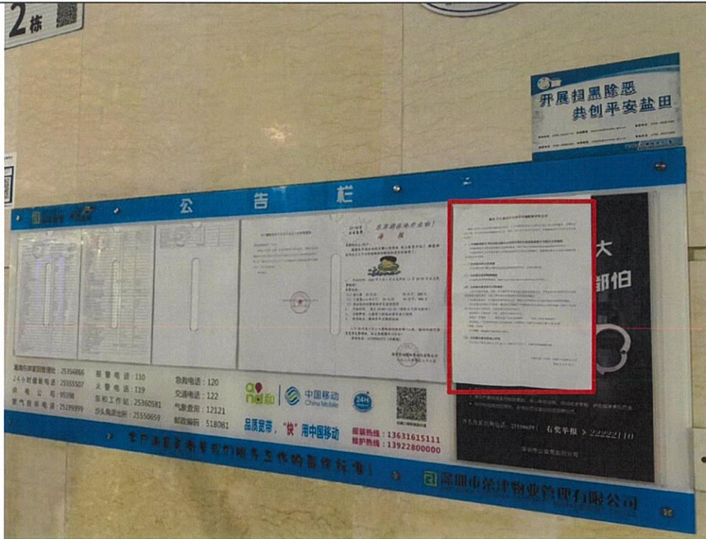
图 7 征求意见稿张贴公告照片 3