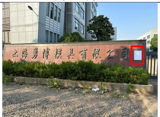
上海勇博模具有限公司门口