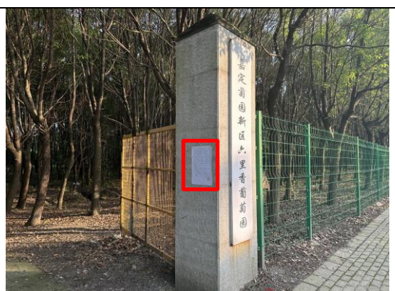
嘉定菊园新区六里香葡萄园门口