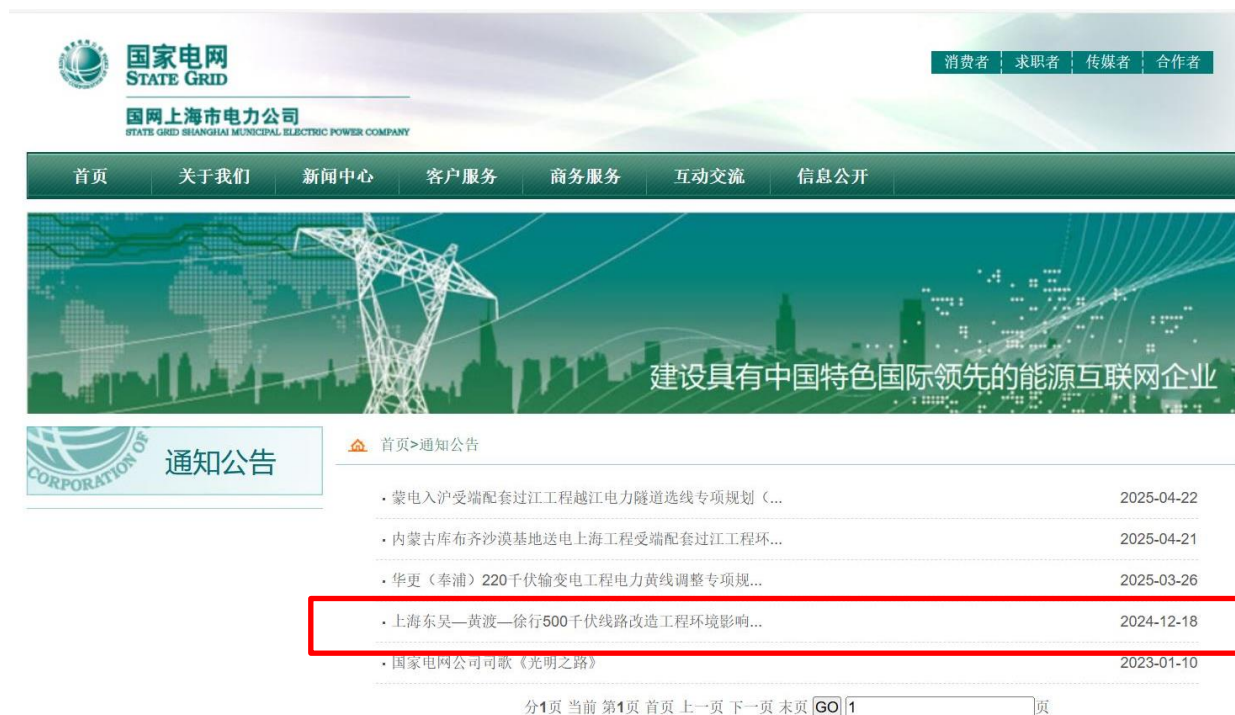
图 2-1(1) 首次环境影响评价信息公示截图