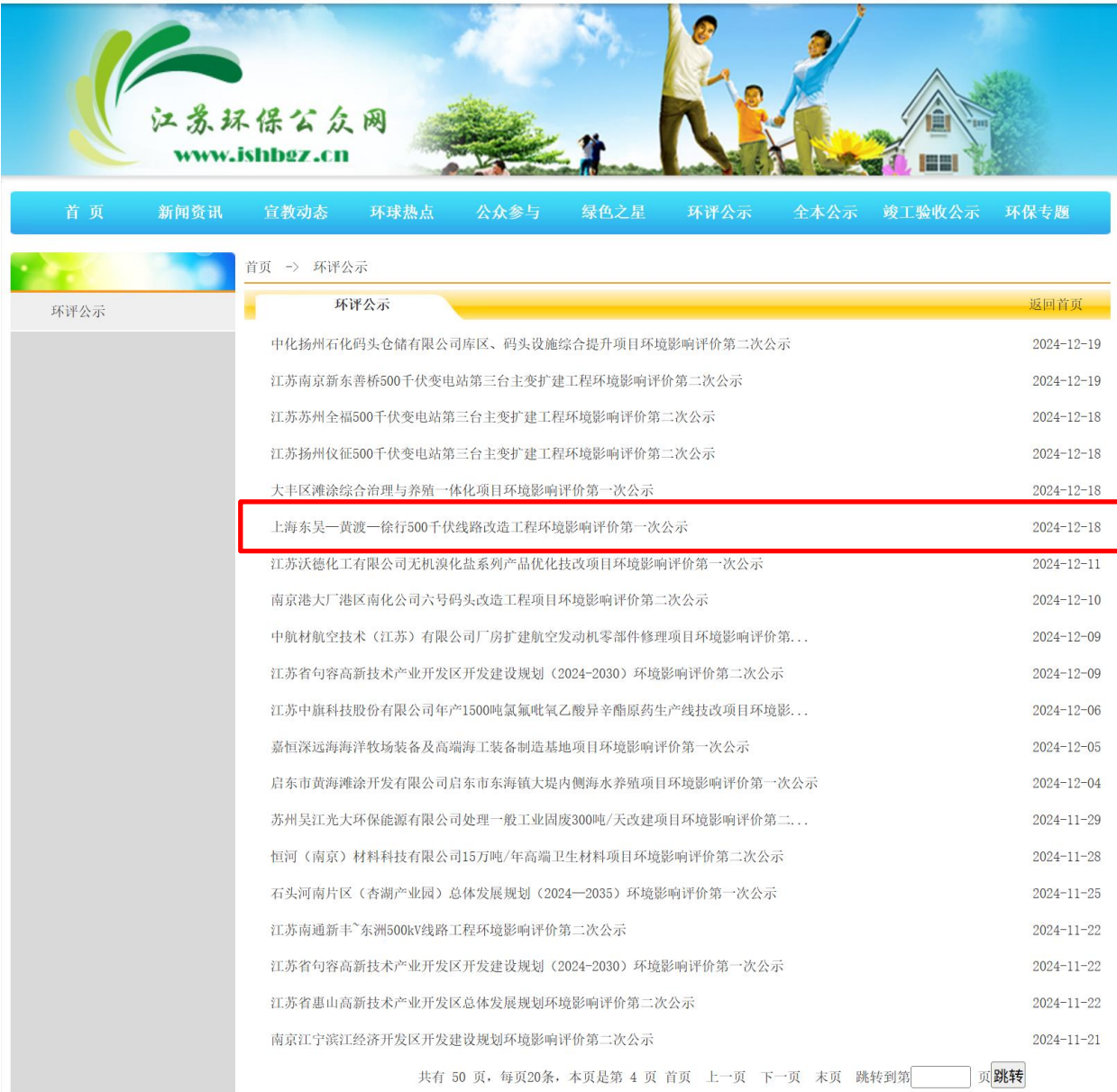
图 2-2(1) 首次环境影响评价信息公示截图（江苏环保公众网）