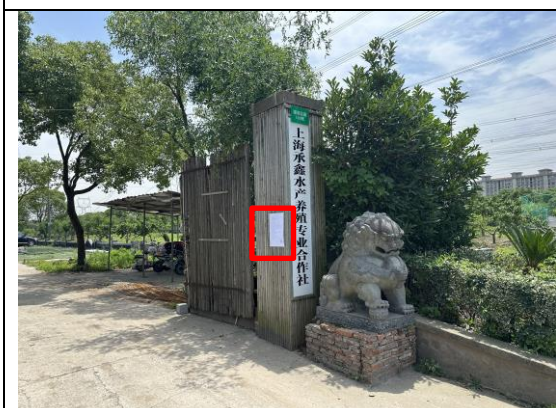
澄浏公路 700 号企业门口