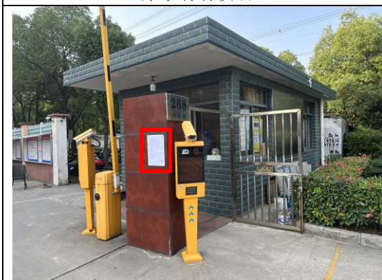
园区路 268 号企业门口