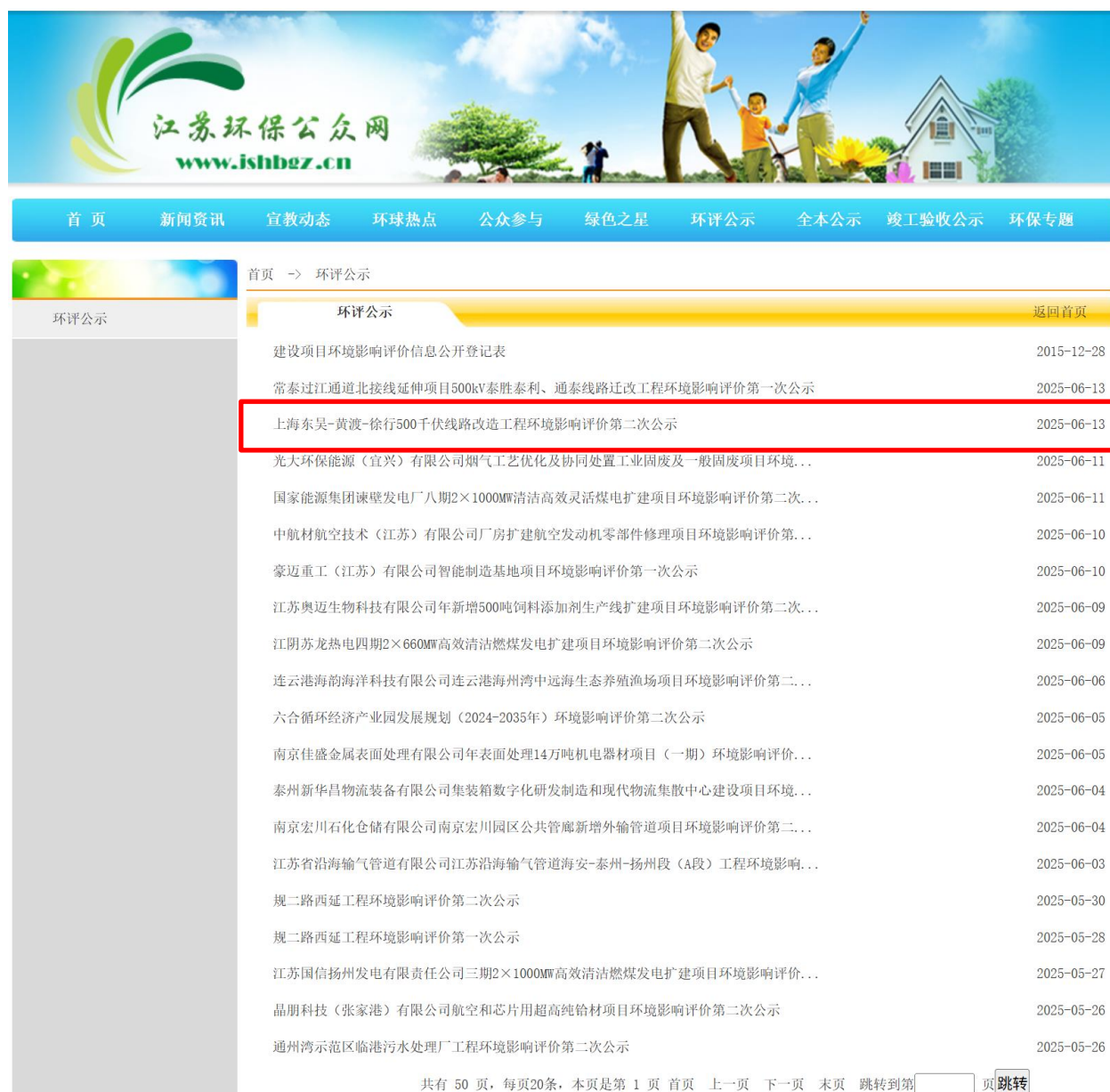
图 3-2(1) 征求意见稿公示截图（江苏环保公众网）