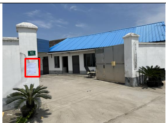
徐行镇南片大理港河段养护项目部门口