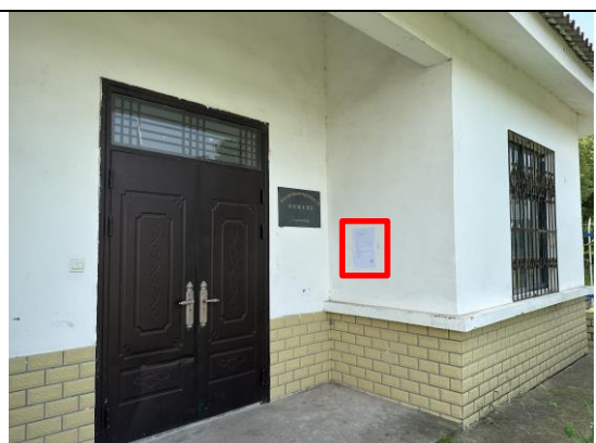
徐行柴堂灌区泵房门口