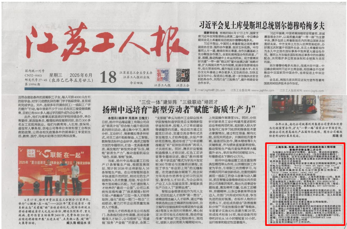
图 3-5(2) 《江苏工人报》截图（2025 年 6 月 18 日）