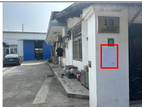
宝安公路 4718 弄 13 号企业门口