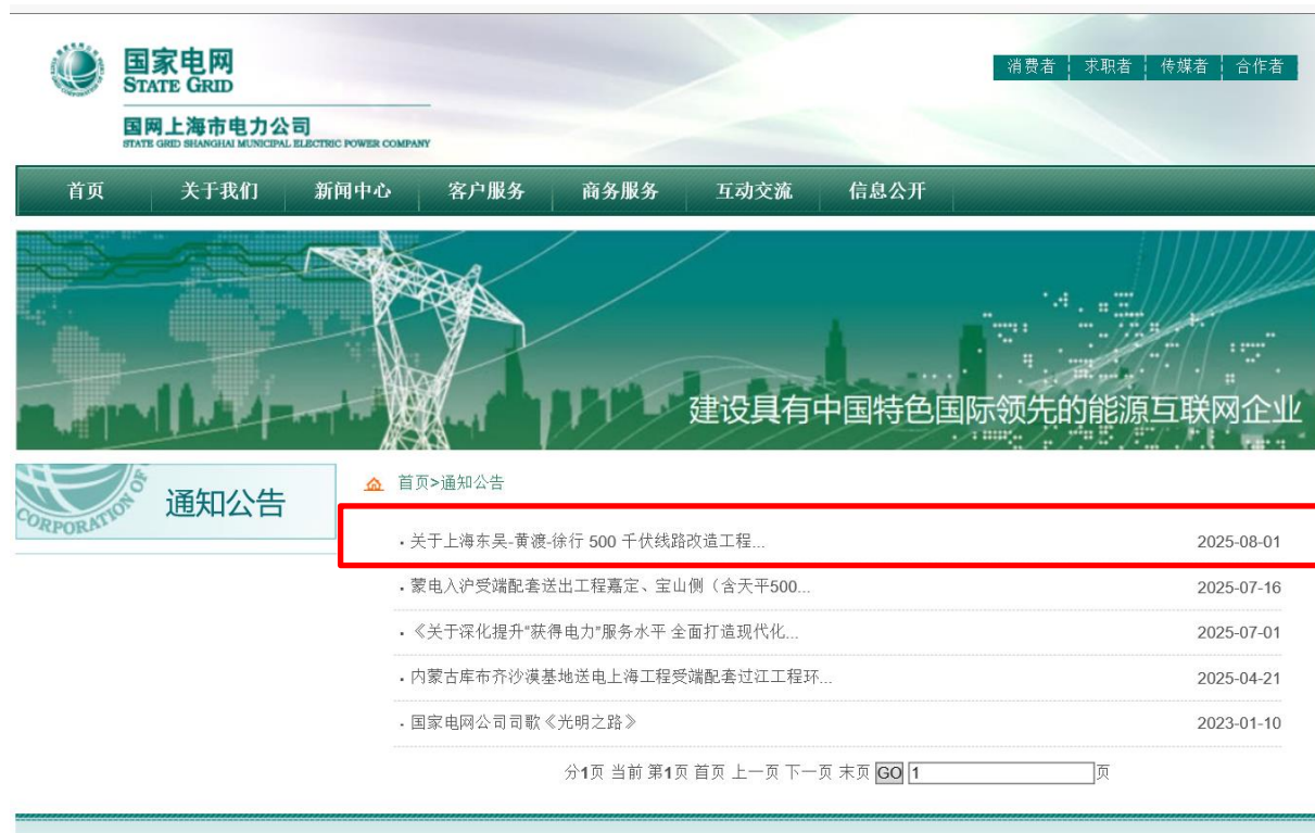
图 6-1(1) 国网上海市电力公司网站送审稿全本公示截图（2025 年 8 月 1 日）