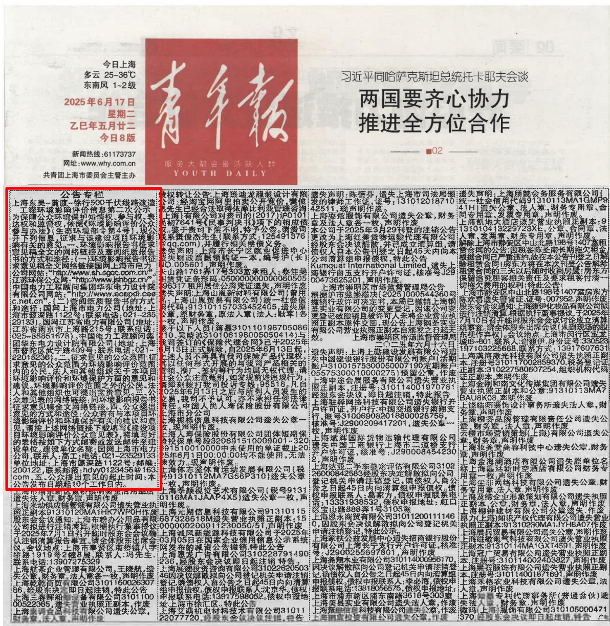
图 3-4(1) 《青年报》截图 (2025 年 6 月 17 日)