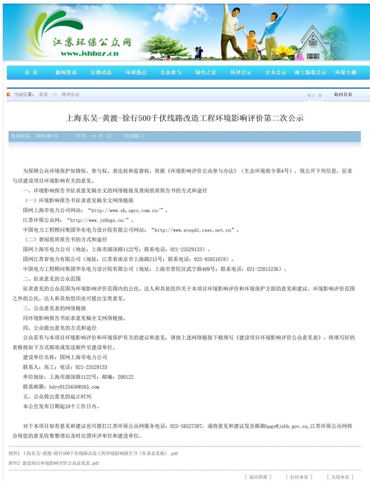
图 3-2(2) 征求意见稿公示截图(江苏环保公众网)