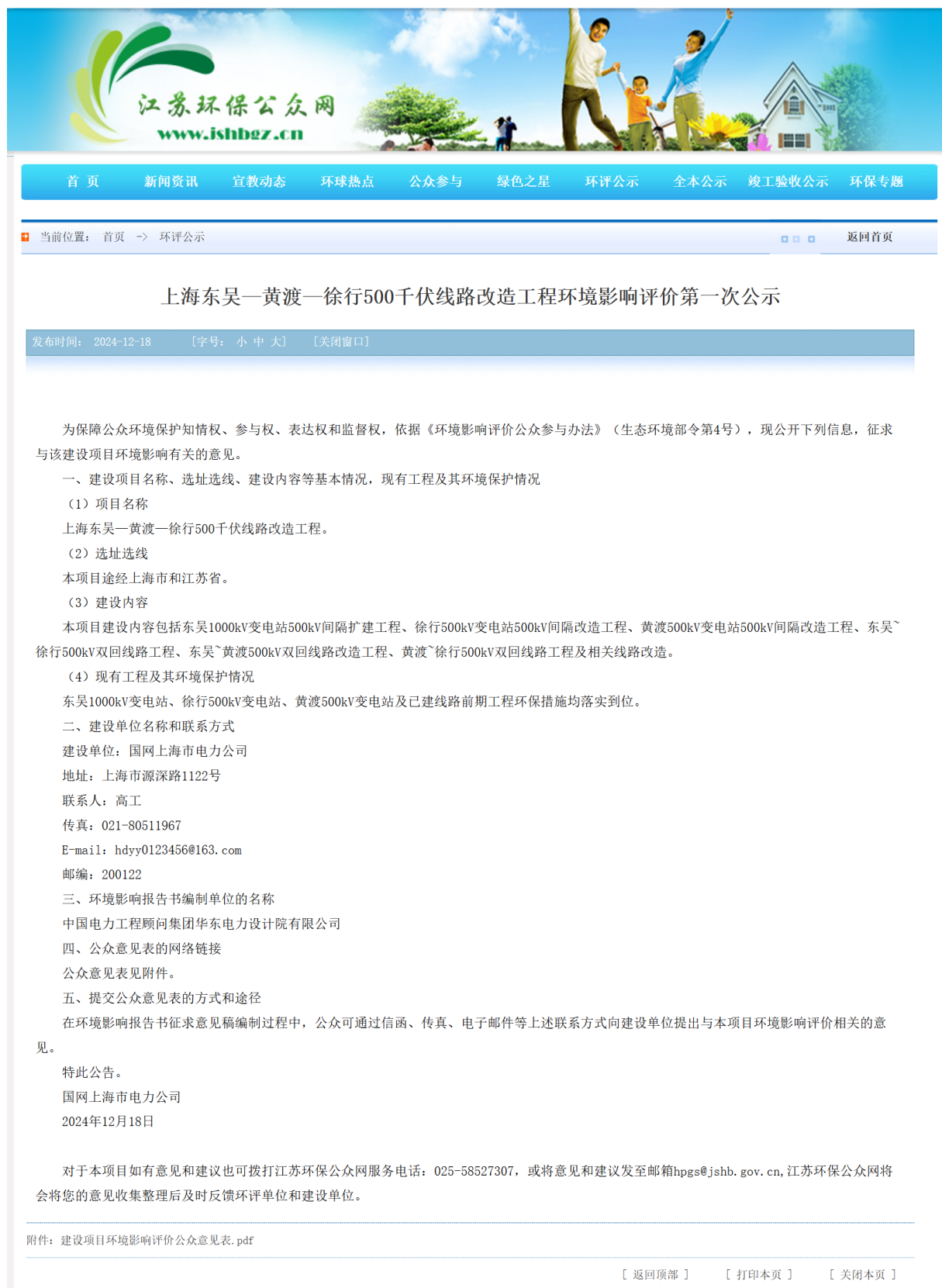
图 2-2(2) 首次环境影响评价信息公示截图(江苏环保公众网)