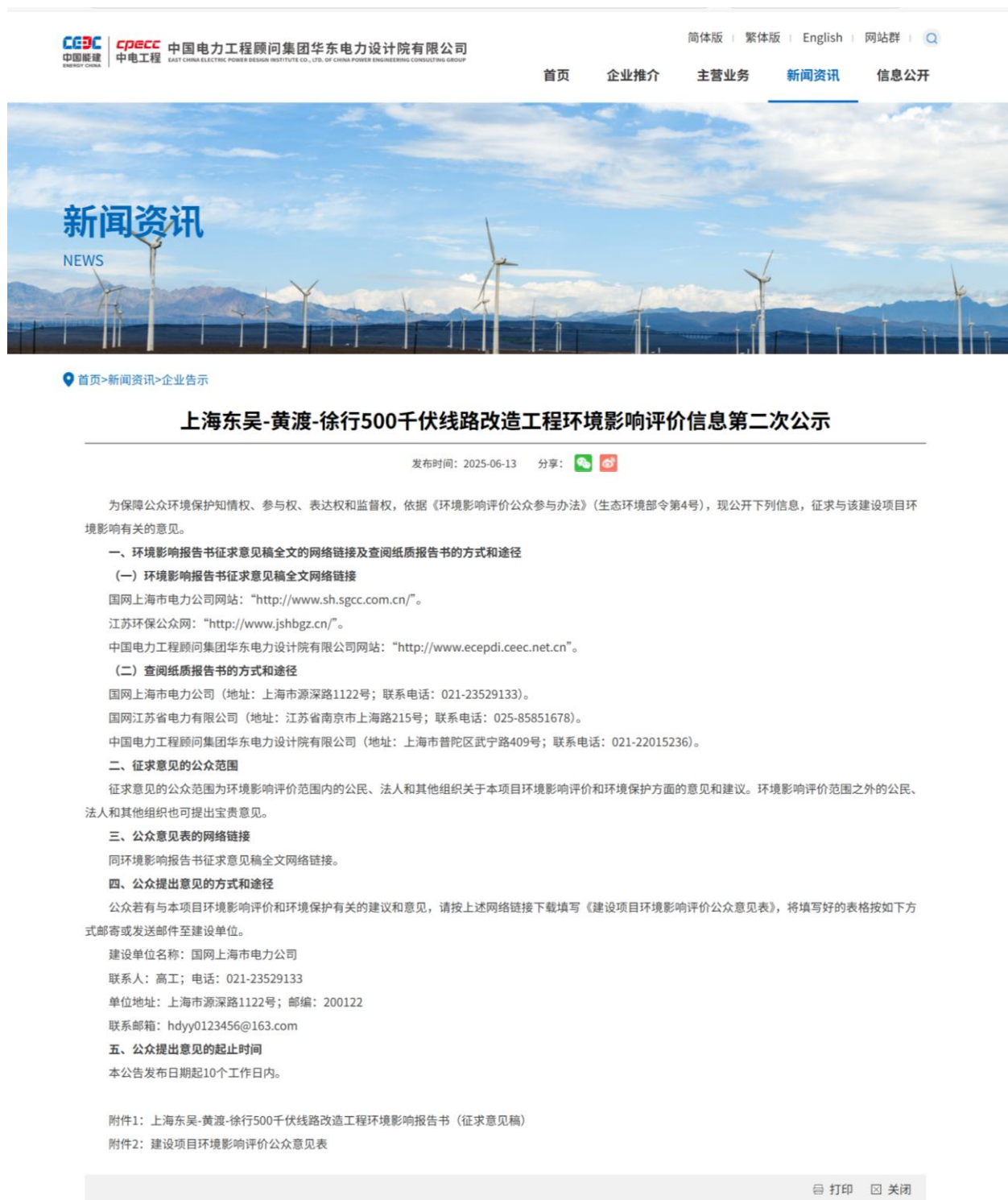
图 3-3(2) 征求意见稿公示截图(中国电力工程顾问集团华东电力设计院有限公司网站)