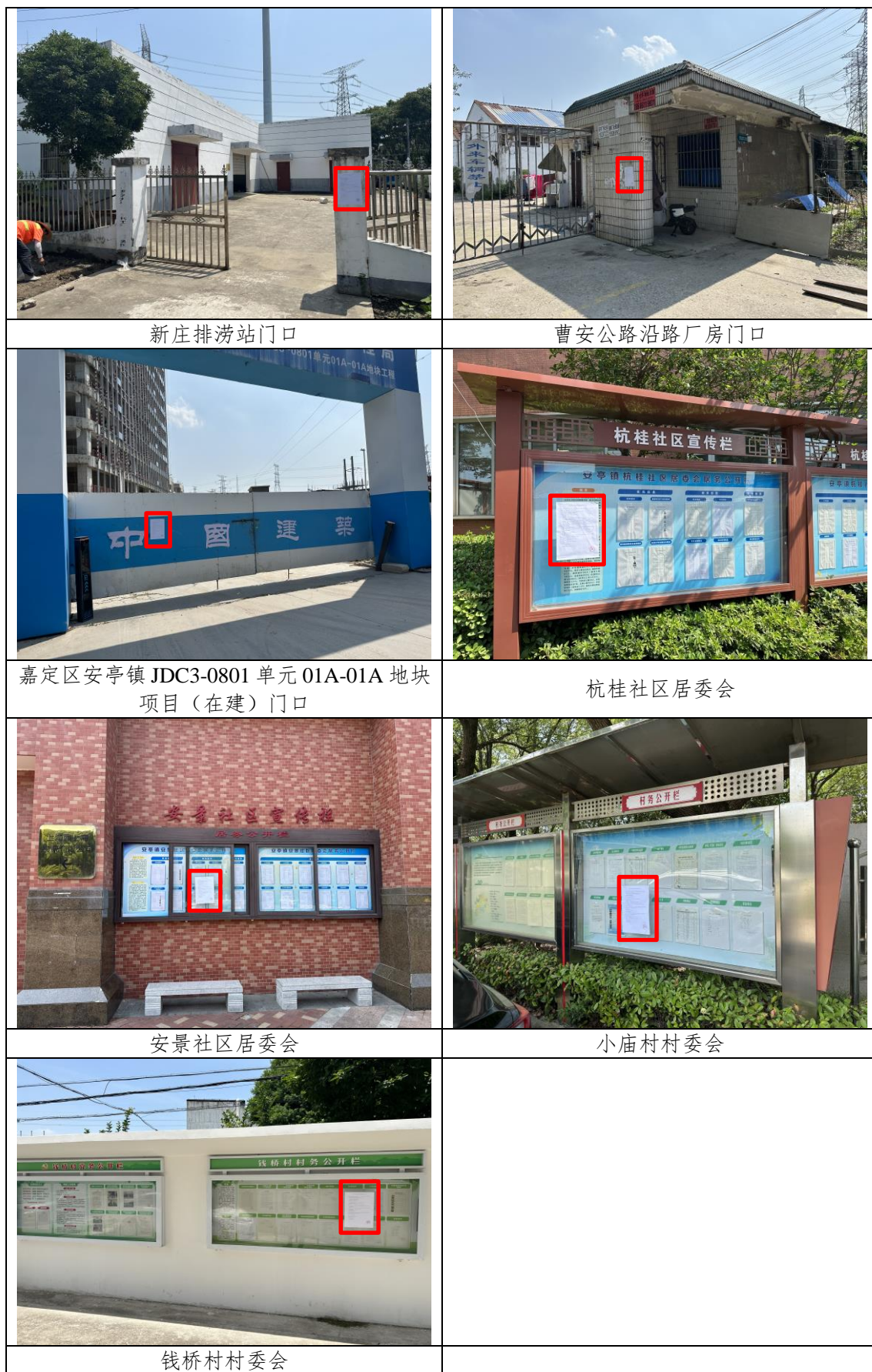
图 3-6 现场张贴照片