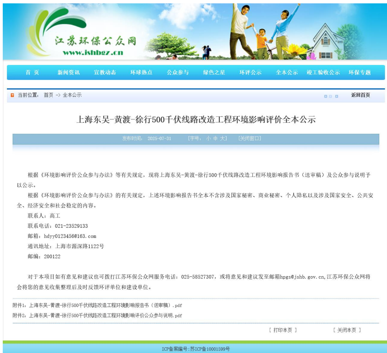
图 6-2(2) 江苏环保公众网网站送审稿全本公示截图(2025 年 7 月 31 日)