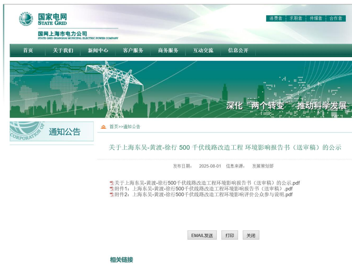
图 6-1(2) 国网上海市电力公司网站送审稿全本公示截图（2025 年 8 月 1 日）