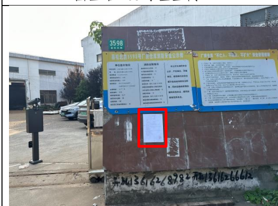
嘉松北路 3598 号企业门口