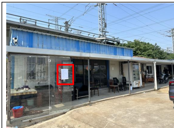
上海嘉定钓友乐休闲垂钓中心门口