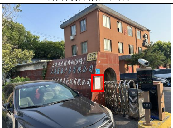
嘉松北路 3570 号企业门口