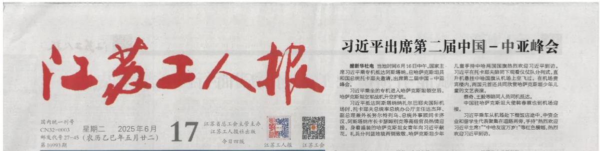
图 3-5(1) 《江苏工人报》截图（2025 年 6 月 17 日）