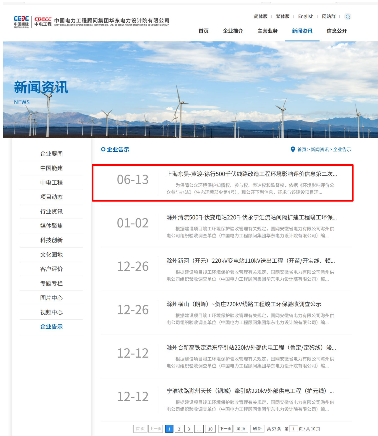
图 3-3(1) 征求意见稿公示截图(中国电力工程顾问集团华东电力设计院有限公司网站)