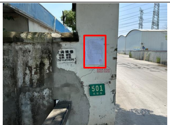
上海君泰混凝土有限公司门口