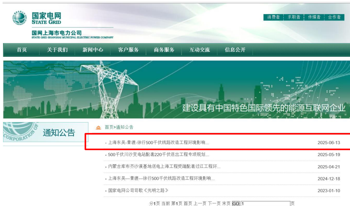
图 3-1(1) 征求意见稿公示截图（国网上海市电力公司网站）