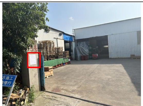
宝安公路 4718 弄 15 号企业门口