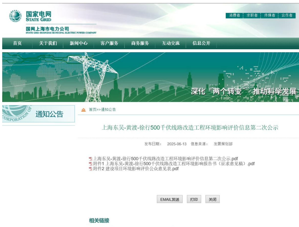
图 3-1(2) 征求意见稿公示截图（国网上海市电力公司网站）