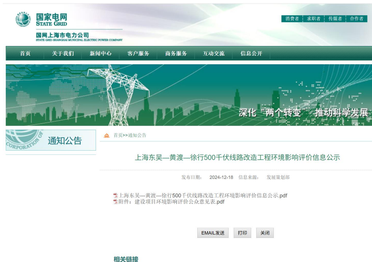
图 2-1(2) 首次环境影响评价信息公示截图（国网上海市电力公司网站）