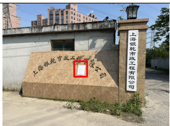
上海银乾市政工程有限公司门口