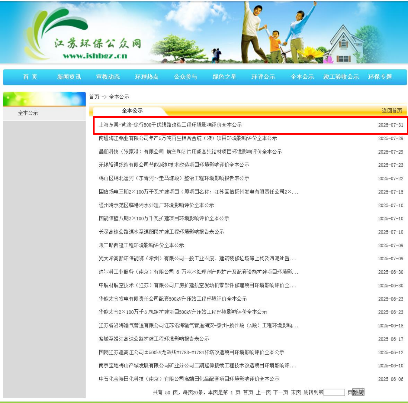
图 6-2(1) 江苏环保公众网网站送审稿全本公示截图（2025 年 7 月 31 日）