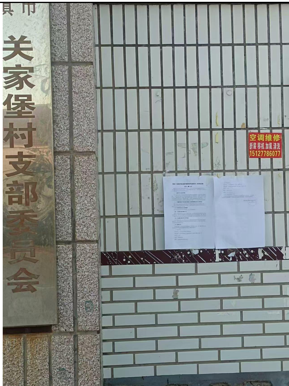
关家堡村村支部委员会现场张贴照片

张贴起始时间为2024年9月9日-2024年9月23日，共10个工作日，符合《环境影响评价公众参与办法》第十一条“持续公开期限不得少于10个工作日”的要求。公示的照片以及全文见图3.2-3。