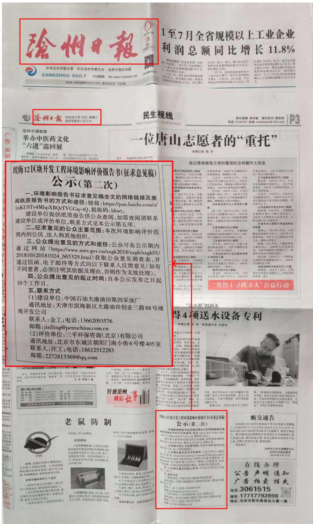
图 3.2-2b 征求意见稿第二次报纸公示