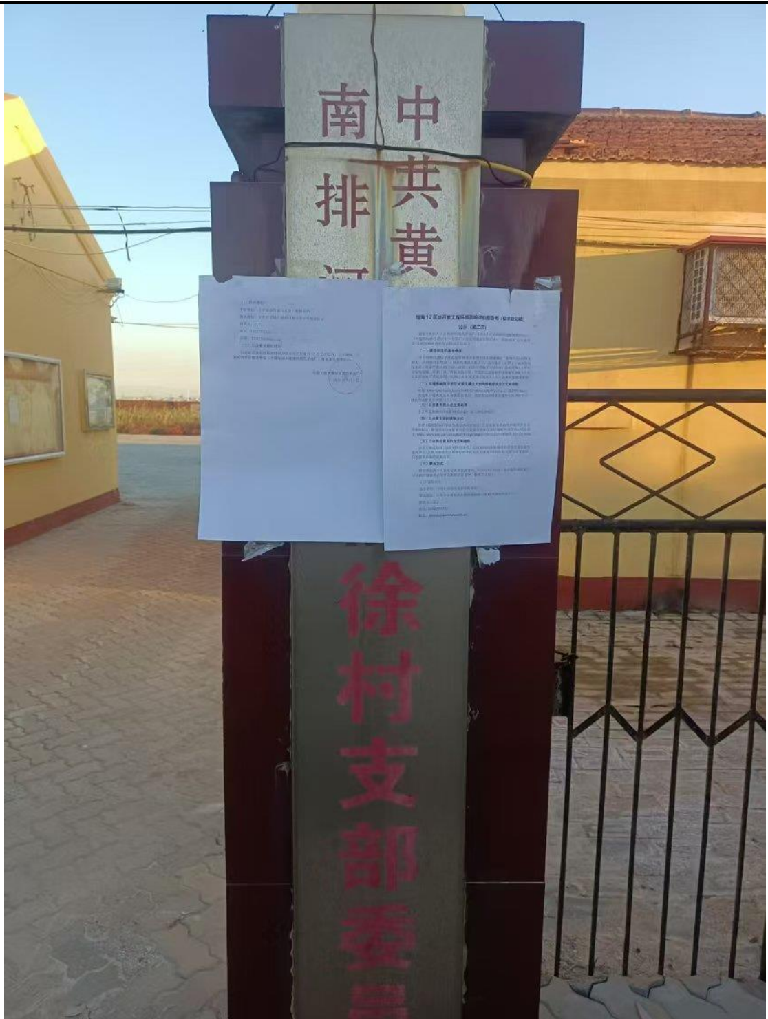
徐村村支部委员会现场张贴照片