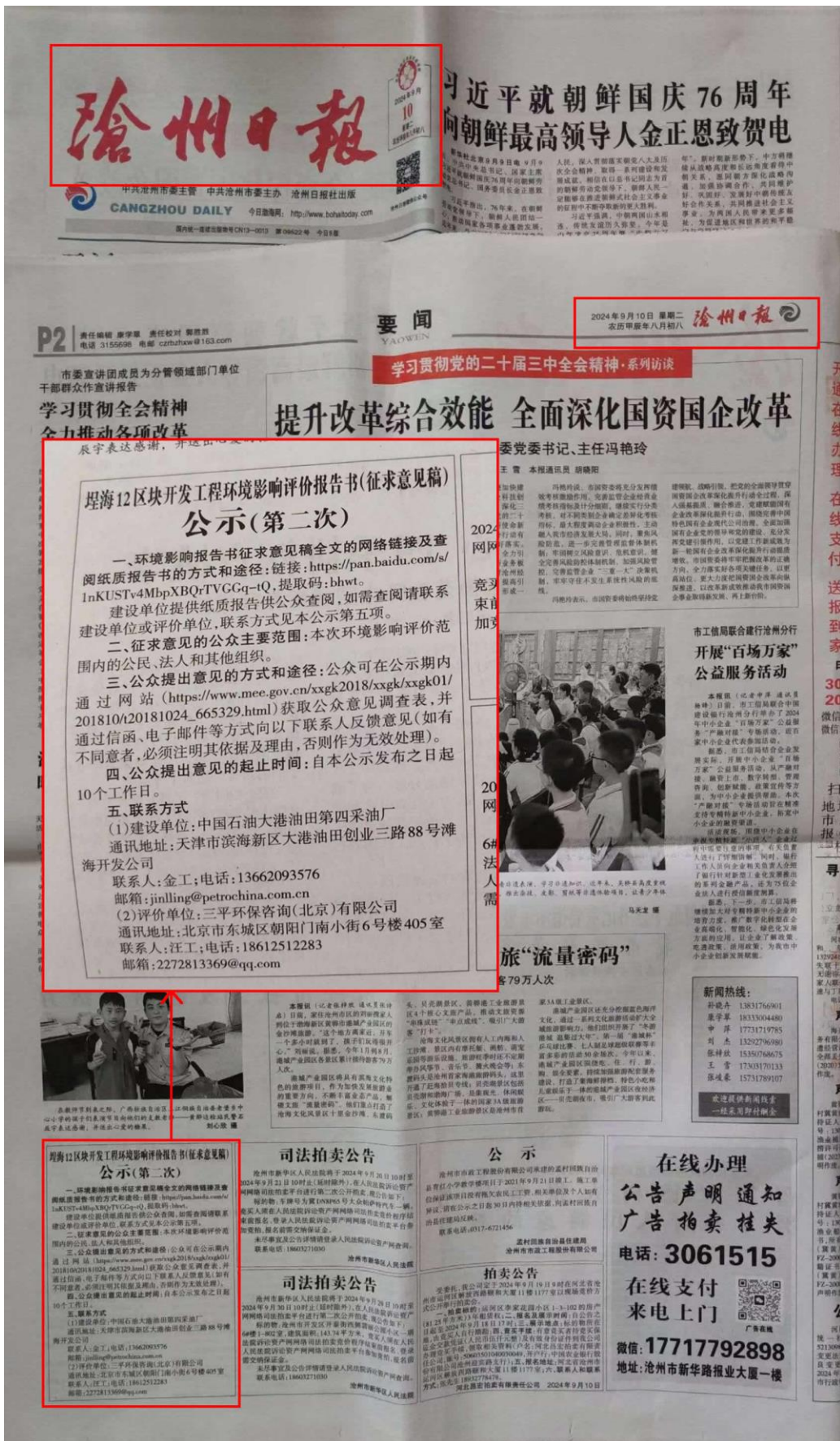
图 3.2-2a 征求意见稿第一次报纸公示