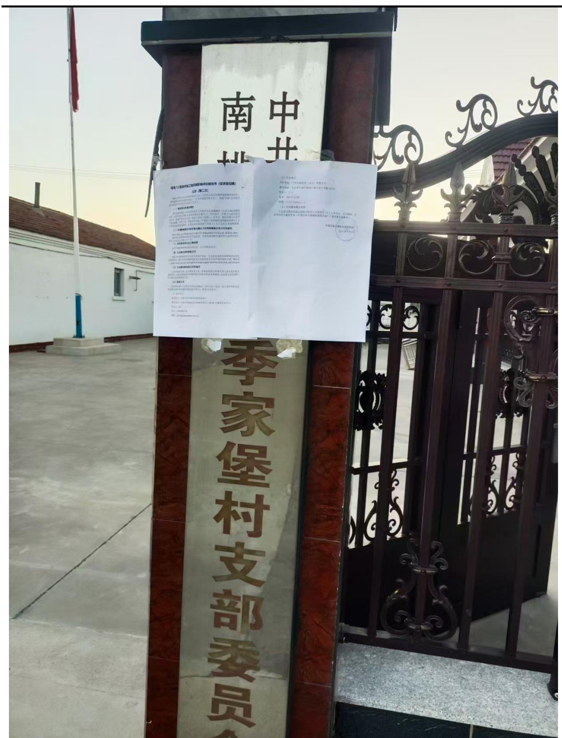
季家堡村村支部委员会现场张贴照片