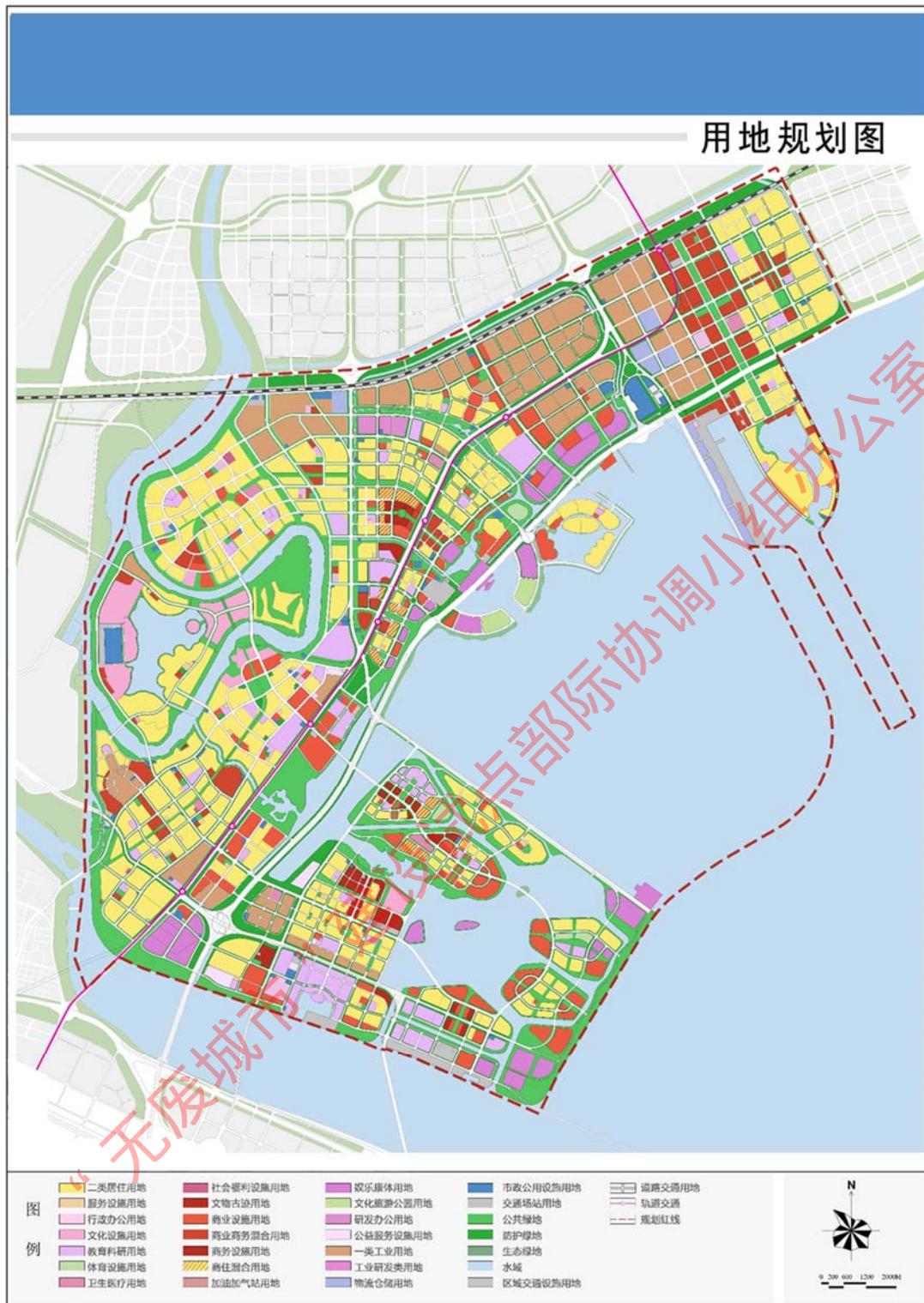
图 1 中新生态城区域规划图